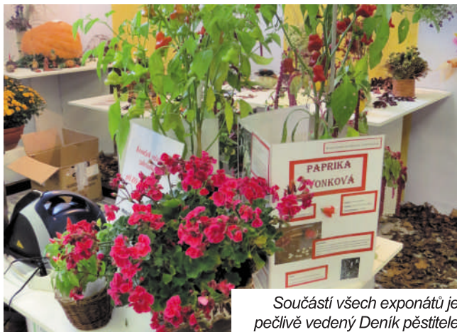
Součástí všech exponátů je pečlivě vedený Deník pěstitele

Podmínkou účasti v soutěži je odevzdaný exponát (truhlík/miska o velikosti: maximálně 60 cm dlouhý truhlík, miska Ø 35 cm) spolu s příloženou podrobnou fotodokumentací včetně písemného záznamu o postupu pěstování k růstu rostlin od výsevu až po předání exponátu do soutěže a tím také doklad o osobní práci.