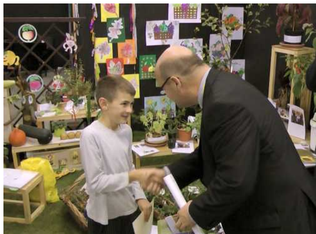
Předávání cen se tradičně účastní významní představitelé kraje či okresu, v roce 2017 při oslavách 60. výročí ČZS předával ceny i předseda ČZS Stanislav Kozlík

Úsovsko. Důležitým sponzorem je pro naši soutěž také Výstaviště FLORA Olomouc, a.s., které podle možností věnuje pro soutěžící děti volné vstupenky na výstavu, v letošním roce, po zavedení EET za snížené vstupné. Ze strany dětí je kladně hodnocena možnost mít soutěžní výpěstek vystavený přímo v expozici ČZS a to po celou dobu výstavy.