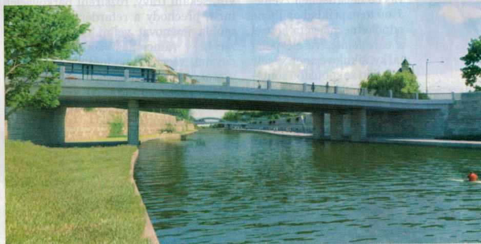
Vizualizace řeky Moravy mezi mosty na ulici Komenského a Masarykova