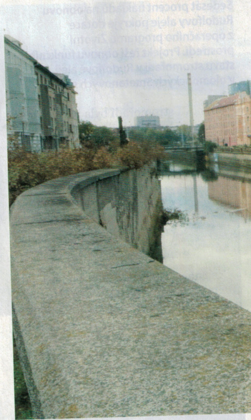
Mezi mosty podél Moravy vzniknou nové snížené bermy. Pravobřežní široká