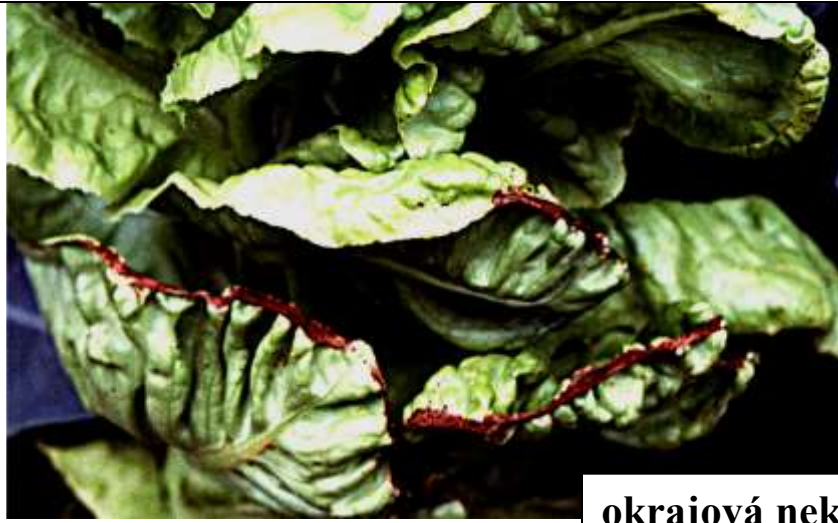
okrajová nekróza listů

Příčina: relativní nedostatek přijatelného vápníku