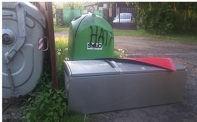
Nefunkční lednice u dolních kontejnerů

Množí se případy, kdy si chataři pletou stanoviště kontejnerů a jejich okolí se skládkou všeho co se jim nehodí (viz výše uvedené obrázky). V současné době je vidět hromada vedle nového stanoviště kontejnerů v Lipové obsahující koberce a matrace. U dolních kontejnerů někdo odložil velkou lednici. Pokud víte kdo je pachatel, sdělte nám to.