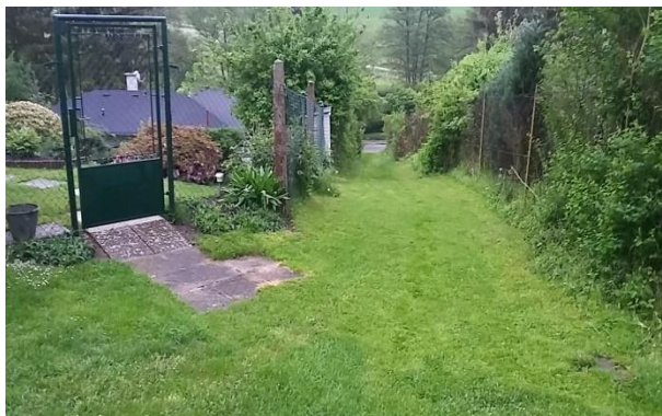
Perfektně upravená požární ulička z Lomené do Třebaňské