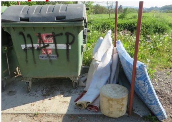
Nepovolená skládka u horních kontejnerů