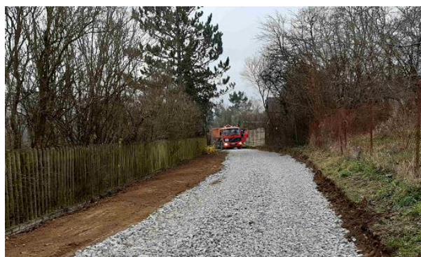
Po navezení hrubého štěrku a urovnání travních pruhů