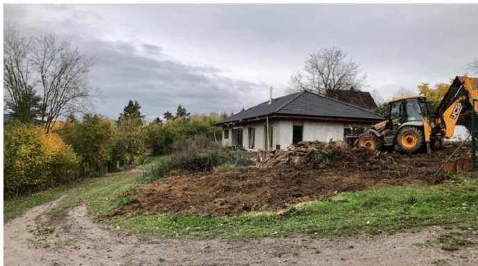
Původní stav uličky K Višňovce