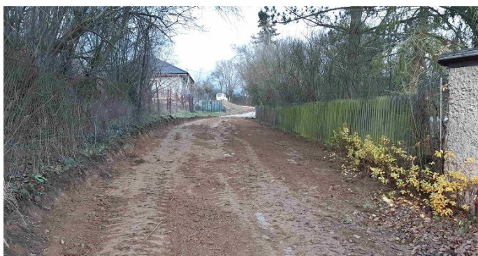
Po vybagrování šikmého terénu a odvezení přebytečné zeminy