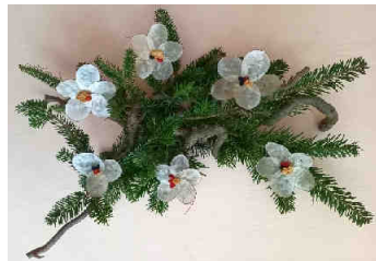
autorka: J. Heřmánková

Musela jsem změnit námět aranžování – poštou se březové větve a přízdoby na plánovaný výrobek poslat nedaly.