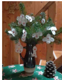
autorka: J. Melicharová