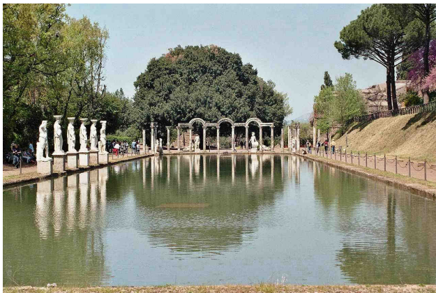
Antická zahrada - Hadriánvila Řím

Nejznámější městské zahrady měly často pravidelný tvar a obvykle byly založeny jako pravidelné, geometrické zahrady. Využití zahrady jako součásti obydlí bylo ještě používanější než u Řeků. V zahradách se i spávalo. Uprostřed pravidelně uspořádaného peristylu stála kašna nebo vodotrysk, cesty byly dlážděné, lemované květinovými záhony. Na