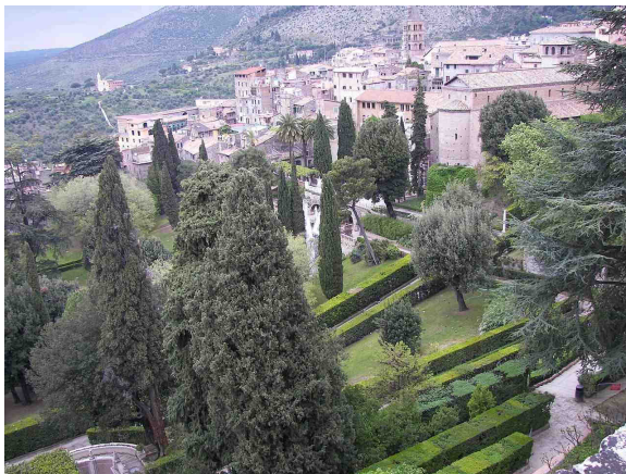
Renesance, Villa d'Este, Tivoli

stejných hledisek jako celá stavba, na jejíž půdorys navazuje. Na dvorech panovníků nesloužila jen obytným a dekoračním účelům, ale i jako sbírka rostlin, zoologická sbírka cizokrajných živočichů, často ptáků, a hříček. Taková zahrada se často zvrhla v chaotickou zmeť, a proto ji bylo nutné architektonicky cestami, zíd-kami, dřevěnými a živými ploty rozčlenit na jednotlivé sekce. Půdorys zahrady tak zůstává šachovnicovou skládkou.