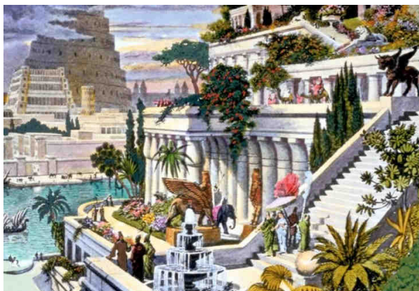
Visuté zahrady Semiramidiny

Diodóros Sicilský (50 př.n.l.) píše: Visuté zahrady Semiramidiny nebyly vystavěny Semiramis, která založila město, ale pozdějším vládcem nazývaným Kýros kvůli kurtizáně, která pocházela z Persie. Tato zahrada byla 400 stop čtverečných velká a stoupala až na vrchol hory, kde byla budova a otevřené místnosti jako je u divadla. Podle schodiště byly postaveny nad sebou oblouky, mírně vystoupavě,