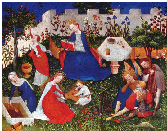
Středověk - raiská zahrada

Středověké zahrady v Evropě byly především malé, jednoduché, obezděné, geometrické zahrady, vyznačující se pravidelností nebo symetrií. Středověká zahrada, nebo takto koncipovaný park, je stejně jako egyptská, římská zahrada