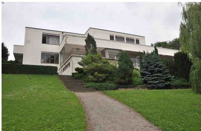
Moderní zahrada. Vila Tugendhat-Brno

Ve třicátých letech byla u nás v Brně vystavěna Vila Tugendhat, která úpravou zahrady sice v mnoha bodech odpovídá principům daného stylu, nicméně zřejmě vypovídá o výsadbách prováděných v tomto období a preferovaném vkusu tehdy sociálně nadřazených skupin obyvatel.