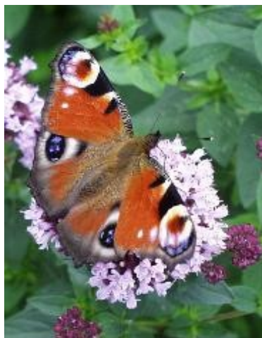
Dobromysl - Oregano nejen pěkně voní, ale je častým cílem motýlů

O zakládání, údržbě a obnově trávniku se dočtete v naší publikaci " Trávník na zahrádce ", ale jsou místa s velmi nepříznivými stanovištními podmínkami pro růst trav, kde je pěstování trávniku prakticky nemožné a nepomůžeme si ani speciálními druhy travin.