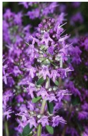
Velmi vonná je především mateřídouška

Aromatické trávníky se stávají v poslední době módní záležitostí. Některé převážně suchomilné rostliny, zvláště v období květu, krásně voní a vytvářejí tak neopakovatelné kouzlo pobytu v zahradě. Při jejich použití pamatujte, že by na zahradě měla převládat jen jedna vůně, proto je nutné brát ohled na ostatní intenzivně vonící rostliny v zahradě. (šeříky, růže, pivoňky aj.)