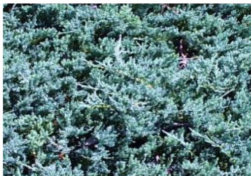
Juniperus horizontalis 'Blue carpet'

Pro půdopokryvné účely se v poslední době stále častěji používají i různé druhy růží, jalovců, vřesů, skalníků, brslenů, mahónií a dalších dřevin, ale tato volba náhrady je spíše z estetických důvodů, neboť uvedené rostliny mají podobné nároky jako trávník. Uvedený výběr zahrnuje rostliny dorůstající běžně do výšky 40 cm, ale pro větší plochy nebo výrazný estetický účinek je možné použít i vyšší.