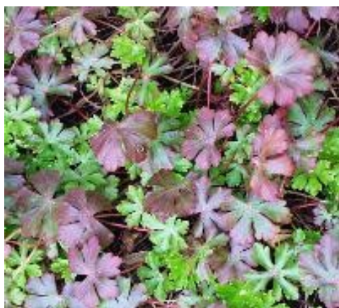
Zajímavé zimní zbarvení listů kakostu