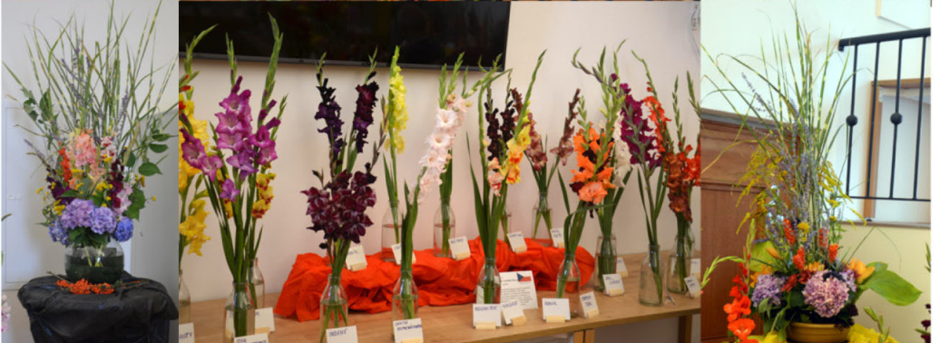
Výstava meččíků, jirín a lilí v Klatovech 2022