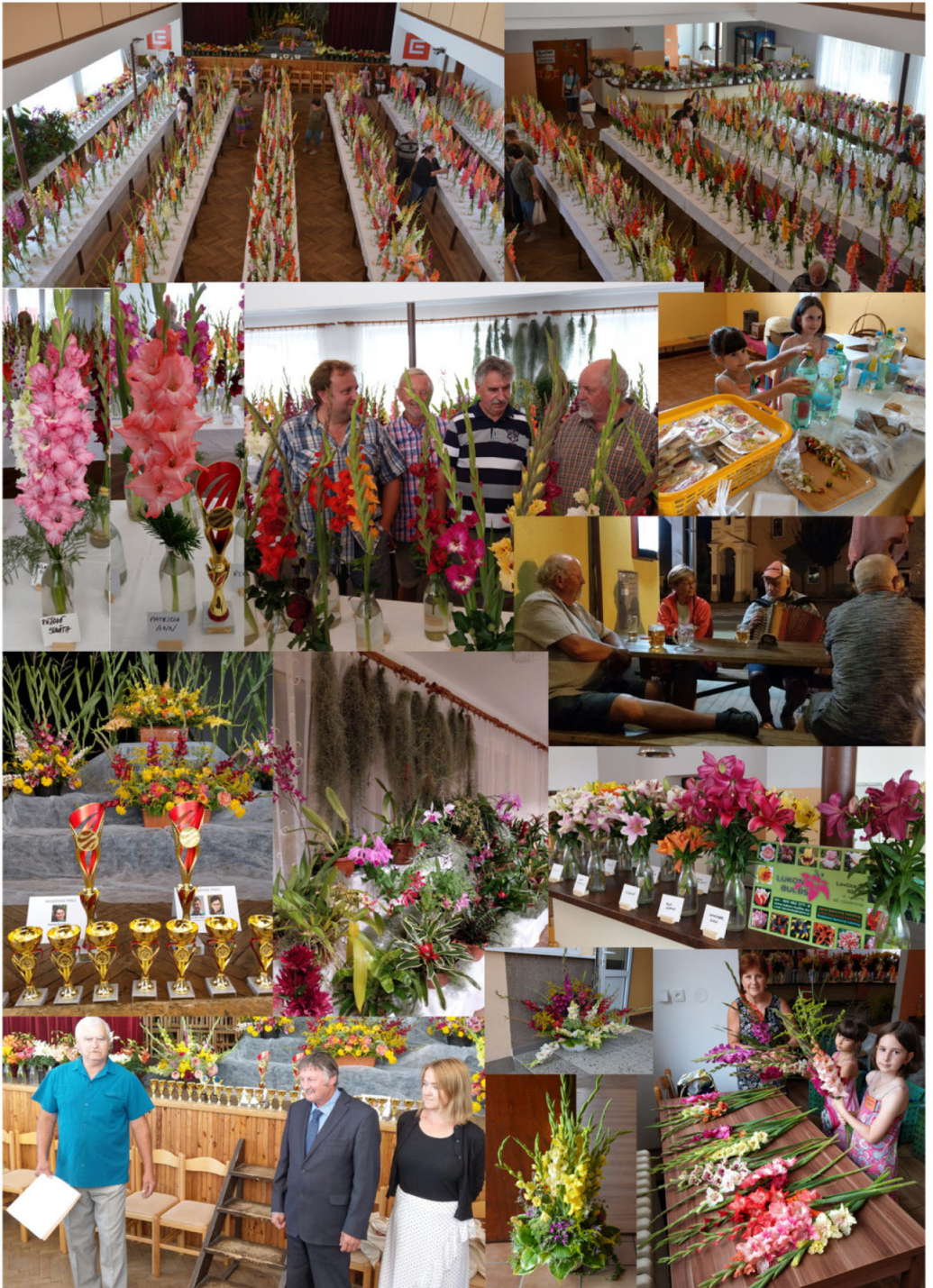
Mezinárodní výstava Neznašov 2022