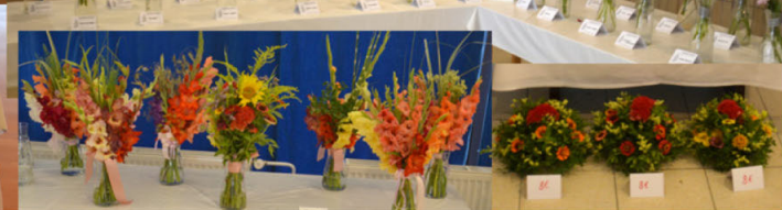
Mezinárodní výstava Bojnice 2022