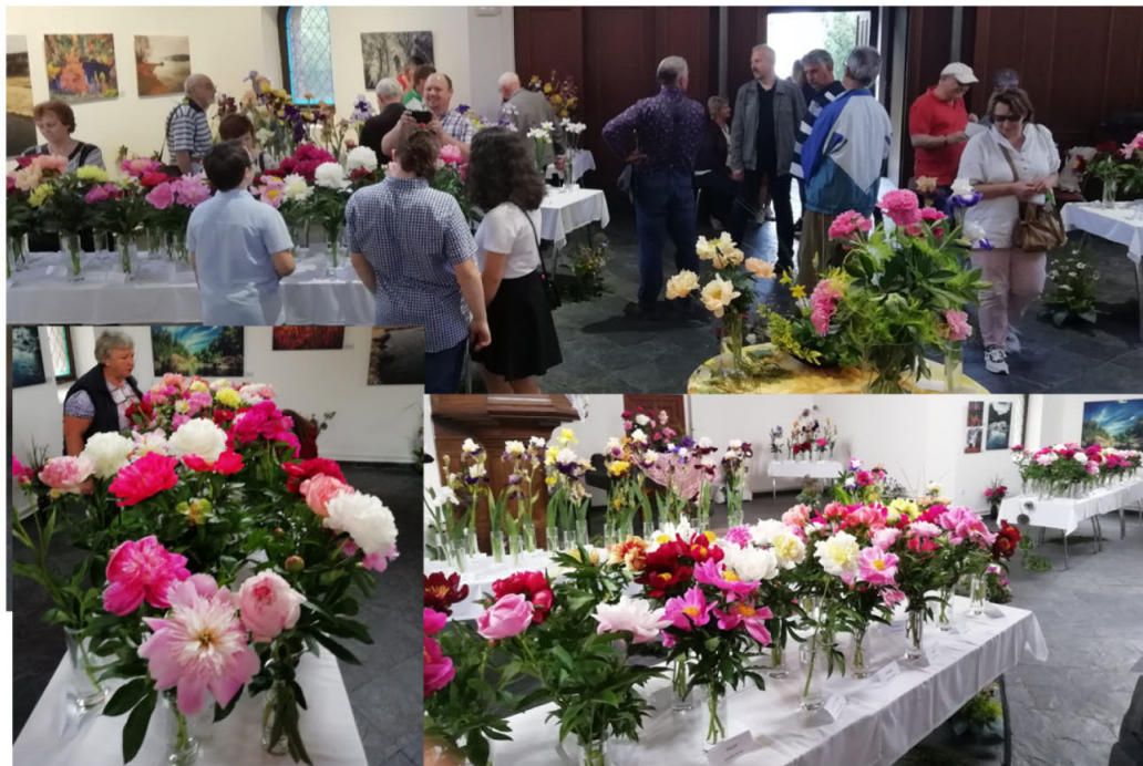
Tradiční výstava kosatců doplněna pivoňkami v Hlučíně