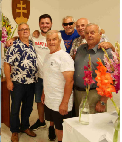
Výstava v Rajeckých Teplicích