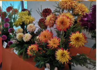
Výstava květin a obrazů Květy – Volyně 2022