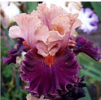
CORRIDA DE TORO