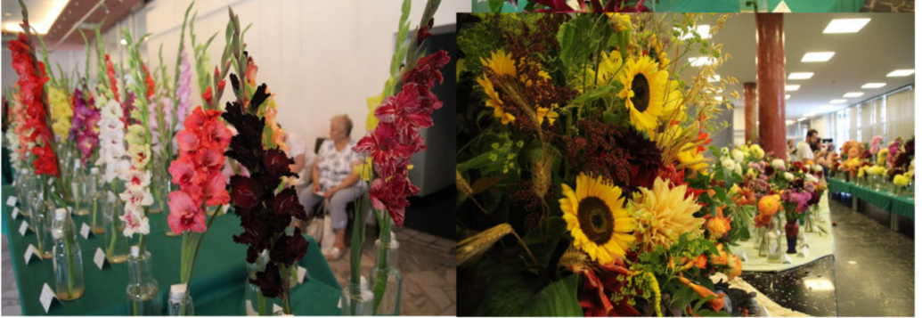
Mezinárodní výstava v polském Rybniku 2022