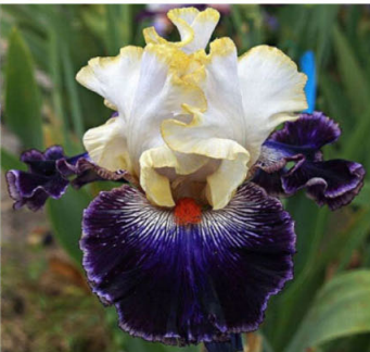
BEAUTY OF ASHES