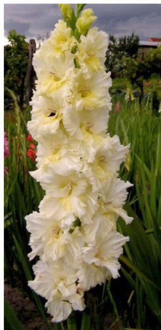
1. místo VANILKA (Mikulášek 2014)