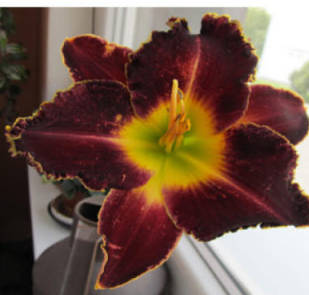
PURPLE OR BLACK