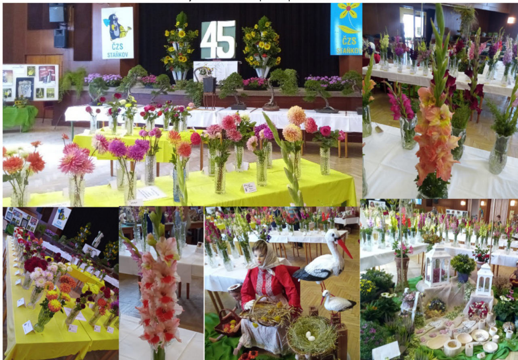
45. letní výstava květin ve Staňkově