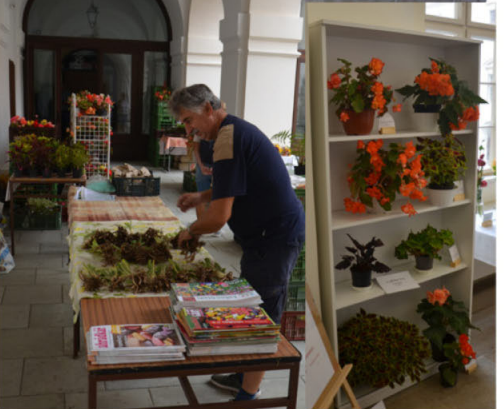
Mezinárodní výstava Holešov 2022