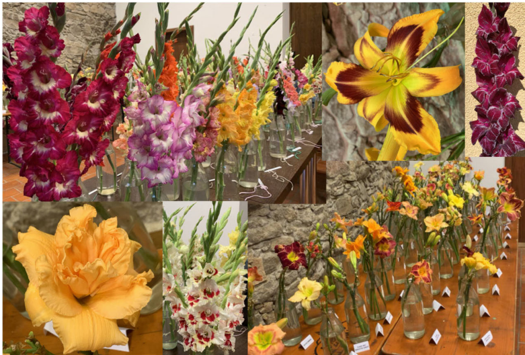
Výstava mečíků a denivek v Nepomuku