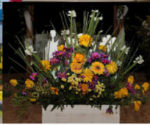
Mezinárodní výstava květin v Rapotíně