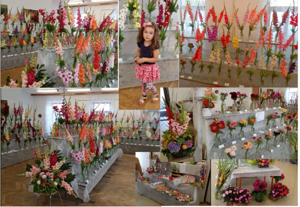
Výstava v Jinošově