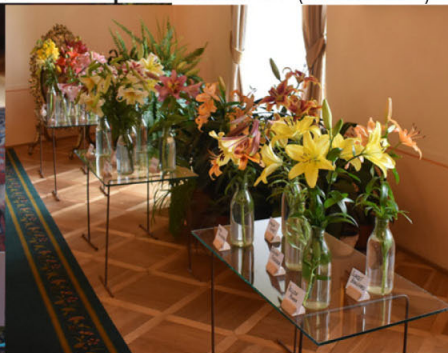
Výstava lilí na zámku v Žirovnici