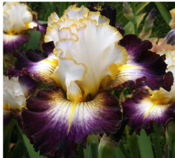
ACCROSS THE UNIVERSE