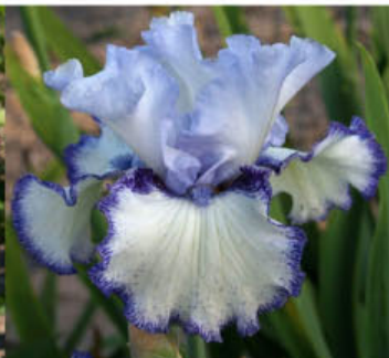
ICE BLUE WEB