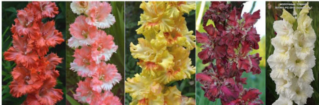
RAJSKIJE RESNIČKI SVETSKAJA DAMA SILA ŽIZNI FONTAN LJUBVI MOLOČNYE TUMANY