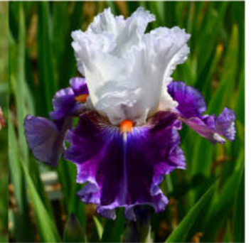
SHAPE OF MY SOUL