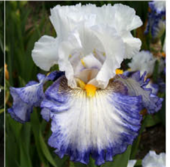
PEARL IN PARADISE