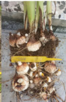
Sklizeň hlíz z kontejnerů