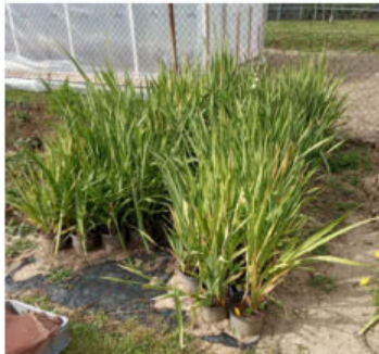
Stav brutu a malých hlízek před sklizní