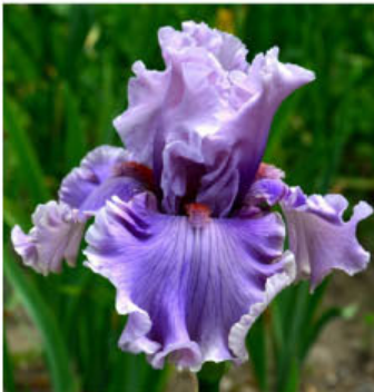
PLEASE FORGIVE ME