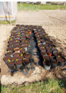
Po vyseči brutu a malých hlízek