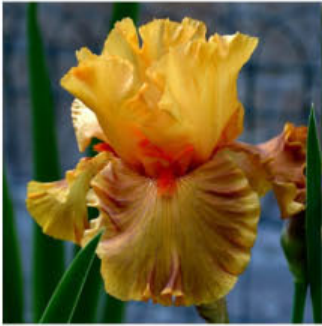
PREFER IT HOT