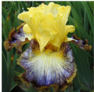
BURST OF ENERGY