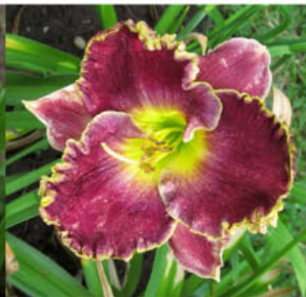
NEW PURPLE SAGE