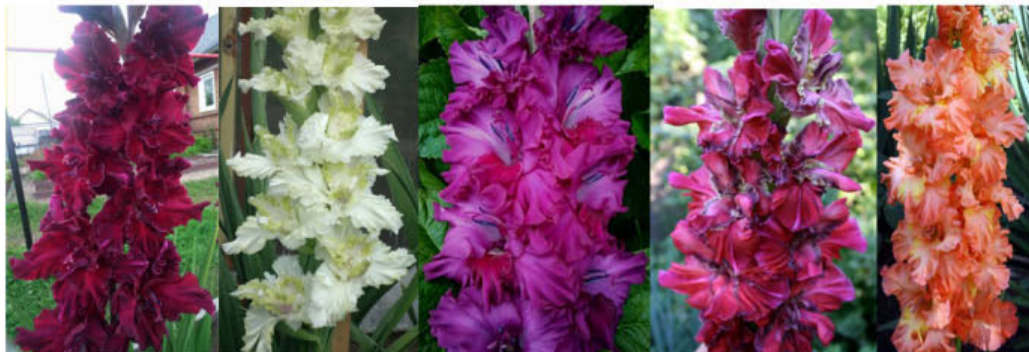
KOROLEVA NOČI MALACHITOVYJ VENEC DUŠEČKA AMENCHOTEP TAJNA PIRAMID