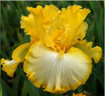
GALACTIC RUFFLED HALO