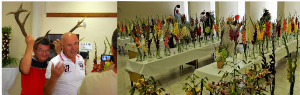
VÝSTAVA RAJECKÉ TEPLICE