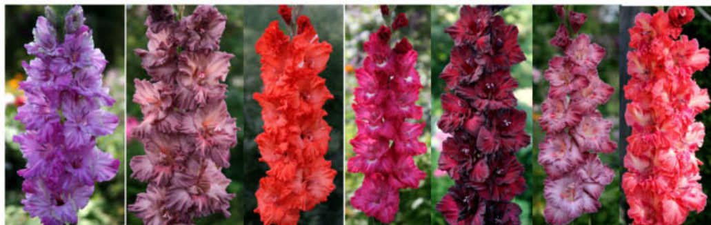
VUAL' V SIRENEVOM GORKIJ ŠOKOLAD MODNIK S BROŠKOJ RETRO STIL' RUBINOVYJE ZVJZDY SINNABON TANEC KARNAVALA