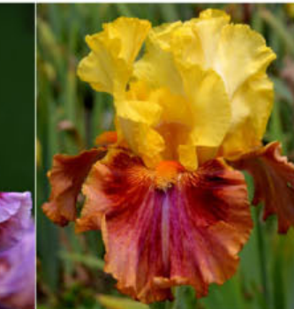
HERO IN THE SUN