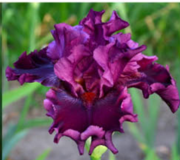
CELEBRATION OF VIOLET