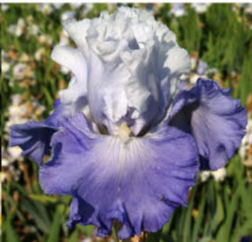
BLUE IN WIND