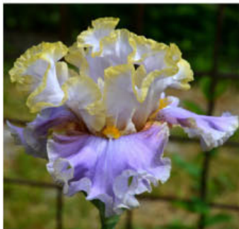
TAKE MY HAND