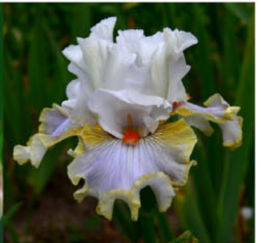
BREAKFAST WITH SUSSI