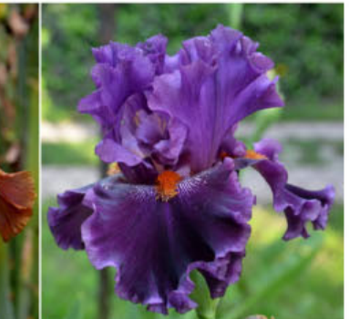
DREAMING ABOUT YOU