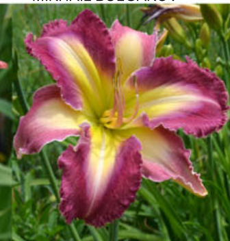
EASTER BUNNY EARS