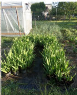
Stav po vzejití brutu