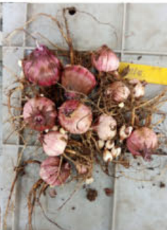
Sklizené hlízy z kontejnerů po odrůdách