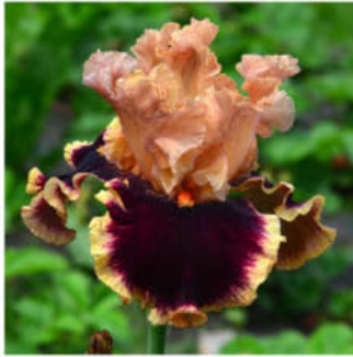
TOUCH AND BURN