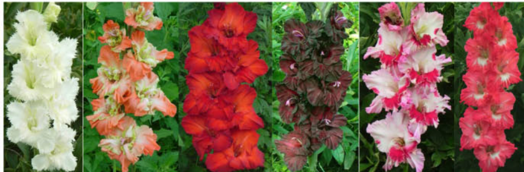
BELIJ JOŽIK ČUŽESTRANKA DOBRYNJA OBJATIJA NOČI VIŠNEVYJ SOBLAZN OBOL'STITELNICA