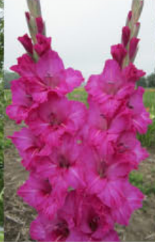
DUKE IT OUT