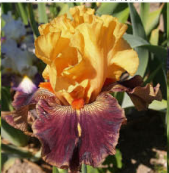
CASHMERE BY MAHOGANY