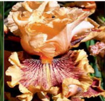
KISS OF TIGER