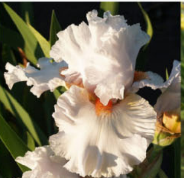
RUBY IN NACRE