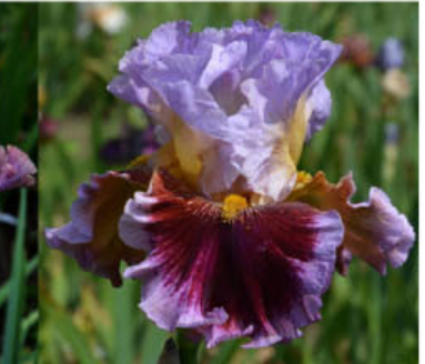
FRIEND FOR LIFE