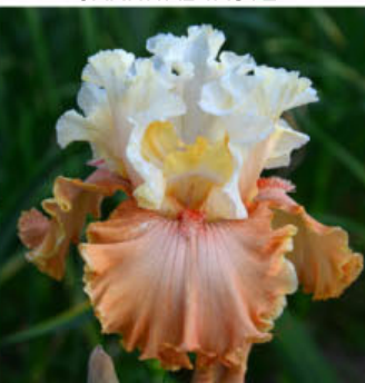
BEAUTY OF THE MOMENT