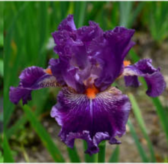
CALL ME VIOLET