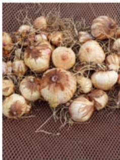
Hlíz dopěstované ze semínek