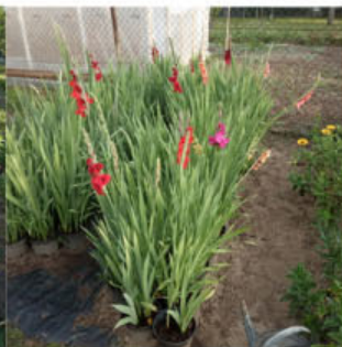
Bruty v kontejnerech v době květu