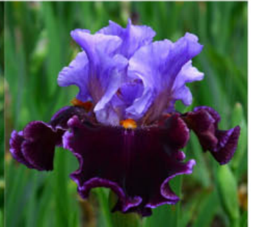
ONE IN A MILLION