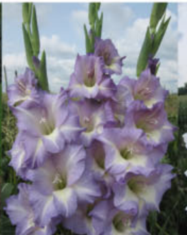
WILD BLUE YONDER