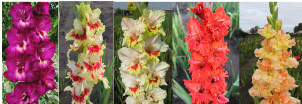
VOSTOČNAJA KRASAVICA DŽANGUL' INKERMEN KASTROPOL' NOVYJ SVET