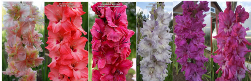
ABRIKOSOVOE UTRO OT VSEGO SERDCA STALNOJ MUSTANG ANGEL SNEŽNYJ ALEKSANDRIT SEDOJ BUREVESTNIK