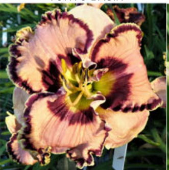
STARORŮŽOVÝ MĚSÍC HAL