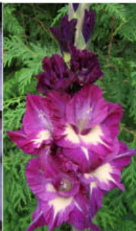
NIGHT N DAY