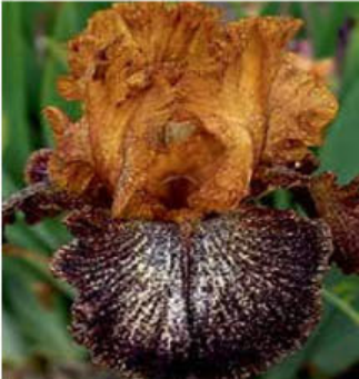
DIPPED HOT CHOCOLATE