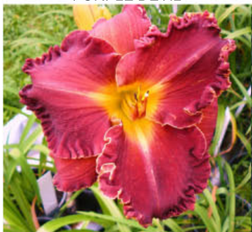
VÍNOVÁ NADĚJE HAL