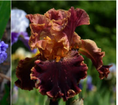
THE BIG BANG