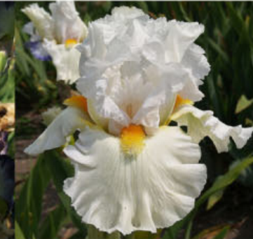
PEARL IN HEAVEN