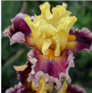
LOOK MY WAY