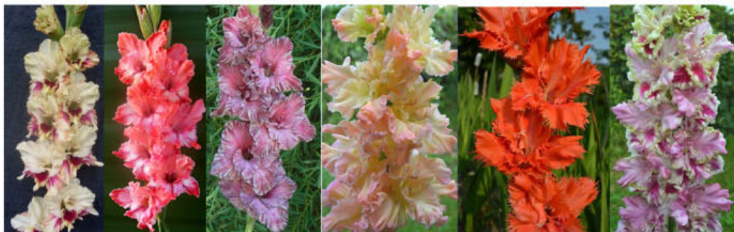
BRIGHT TIME BARBORA RADVILAITÉ MANTIJA VICHRI LJUBVI LOCHMATYJ VINNI-PUCH NOVOJE POKOLENIJE