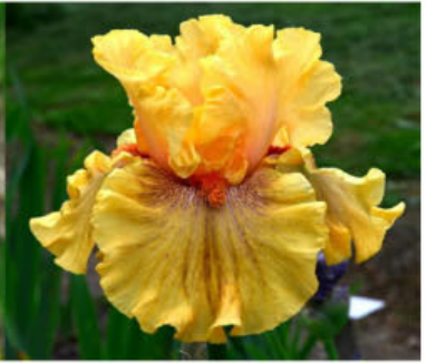
SEE MY HEART