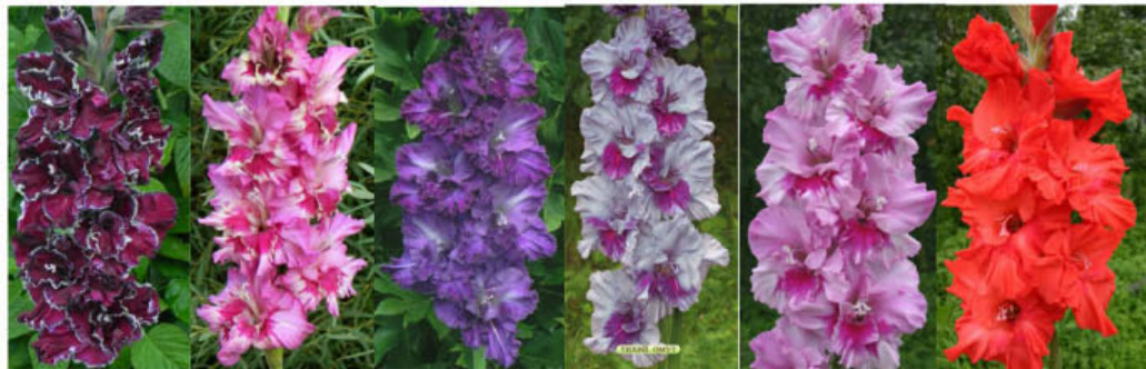
DEŇ PAMJATI STRASTNYJ POCELUJ FLIBUSTĚR TICHIJ OMUT ORION VLADIMIR