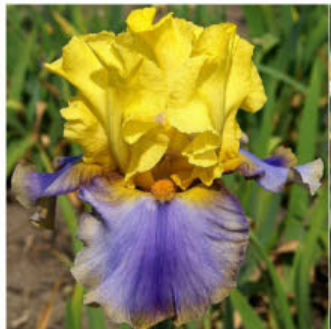
BLUEBERRY AND CARAMEL