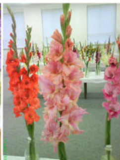
VÝSTAVA RAJECKÉ TEPLICE 2017