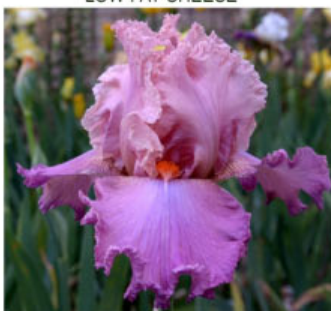
ÚSMĚV SLEČNY HELENKY