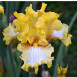
MAKE ME SMILE