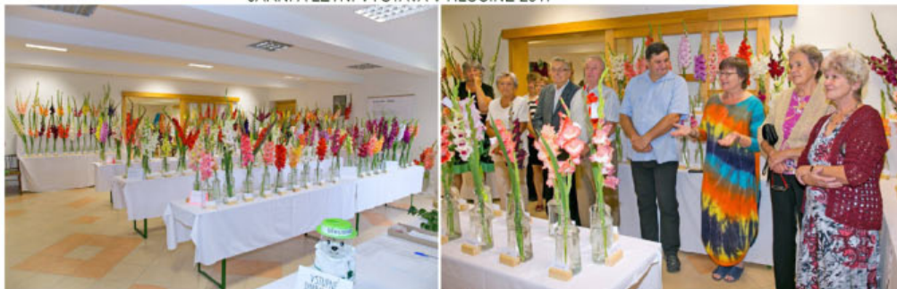
VÝSTAVA RATIBOŘ 2017