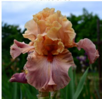
BORN TO ADORE