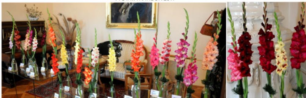
VÝSTAVA ŽIROVNICE 2017