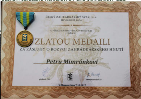
Udělované medaile a diplomy ČZS