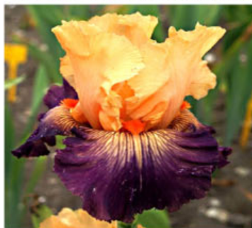
ALBERTO VOJTĚCH FRIČ