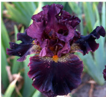
BOHEMIA AFTER DARK