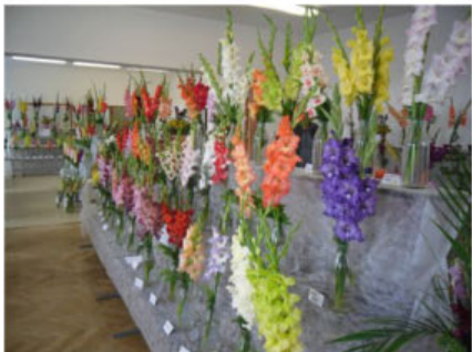
VÝSTAVA JINOŠOV 2017