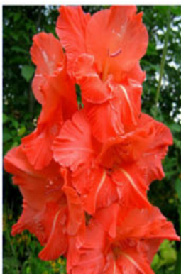
KORALLY DLJA NASTJONY