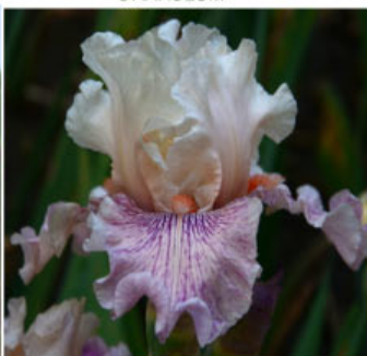
GO FOR SNOW