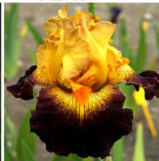
JANTAR A MAHAGON