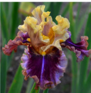
FANCY DRESS PARTY