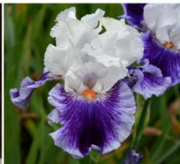
FULL DRESS UNIFORM