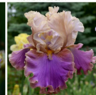
HAVE A NICE DREAM