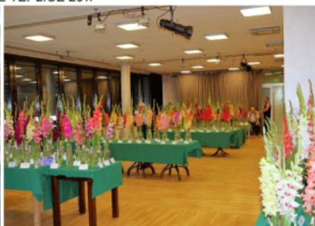
VÝSTAVA RYBNÍK 2017