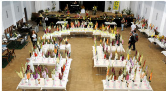
VÝSTAVA RAPOTÍN 2017