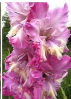
ZVEZDY S NEBES