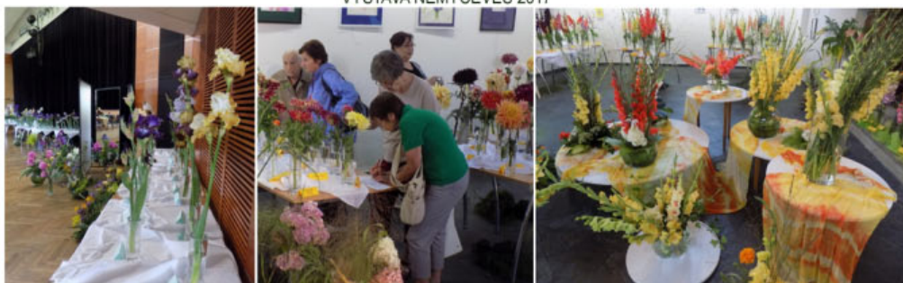
JARNÍ A LETNÍ VÝSTAVA V HLUČÍNĚ 2017