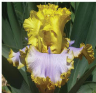
POINT OF INTEREST