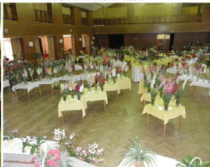
VÝSTAVA STÁNKOV 2017