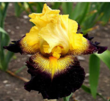
TEQUILA A GRENADINA