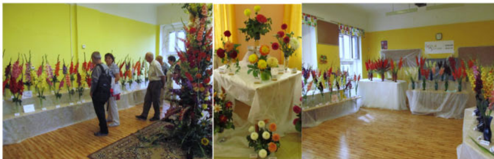
VÝSTAVA NEMYČEVES 2017