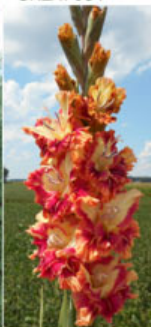
DROP DEAD GORGEOUS