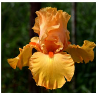
LONG HOT SUMMER