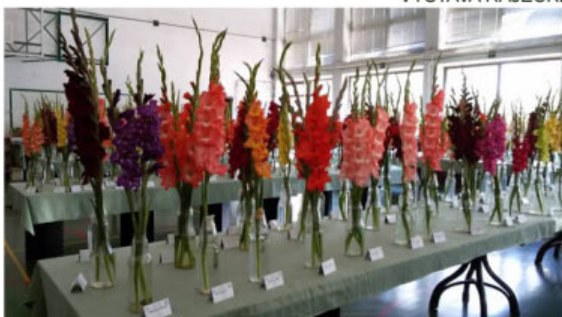
VÝSTAVA MYSLOWICE 2017