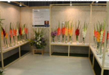
EXPOZICE IVAN ŠARAN