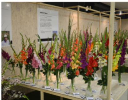
EXPOZICE JAROSLAV TOUŠEK