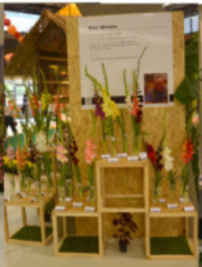
EXPOZICE PIOTR WISTUBA