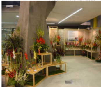
EXPOZICE JAROSLAV KONÍČEK