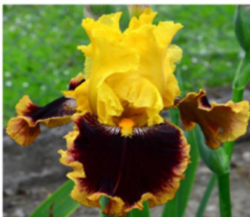
MY LADY JANE