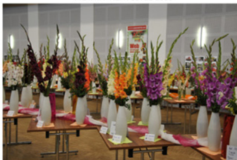
VÝSTAVA RAPOTÍN 2016