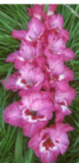
POCELUJ NA BIS