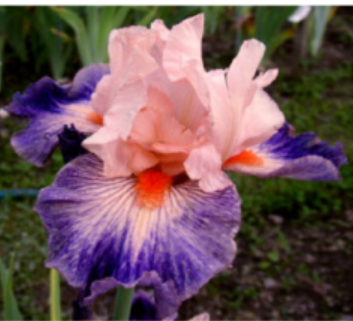
BLUEBERRY CANDY (BB)