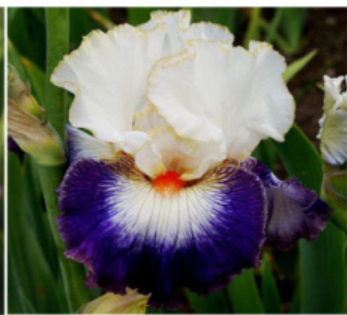
PIRATE 'S SMILE