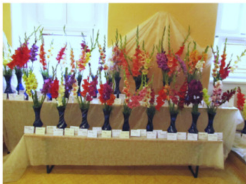
VÝSTAVA NEMYČEVES 2016