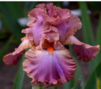
DÁMA V RŮŽOVÉM