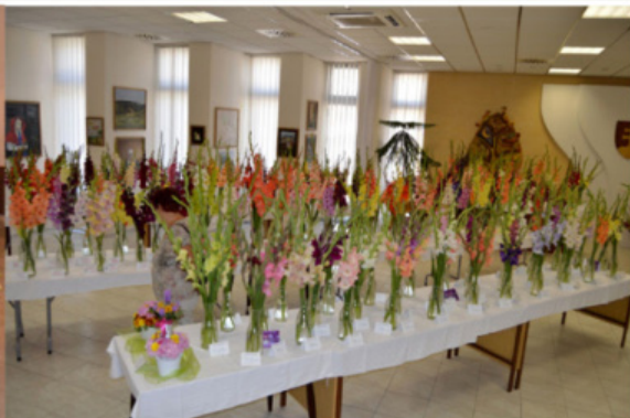
VÝSTAVA RAJECKÉ TEPLICE 2016