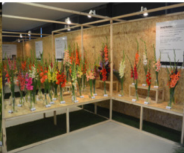
EXPOZICE JURAJ BELIČKA