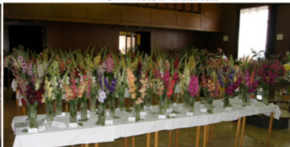
VÝSTAVA STAŇKOV 2016