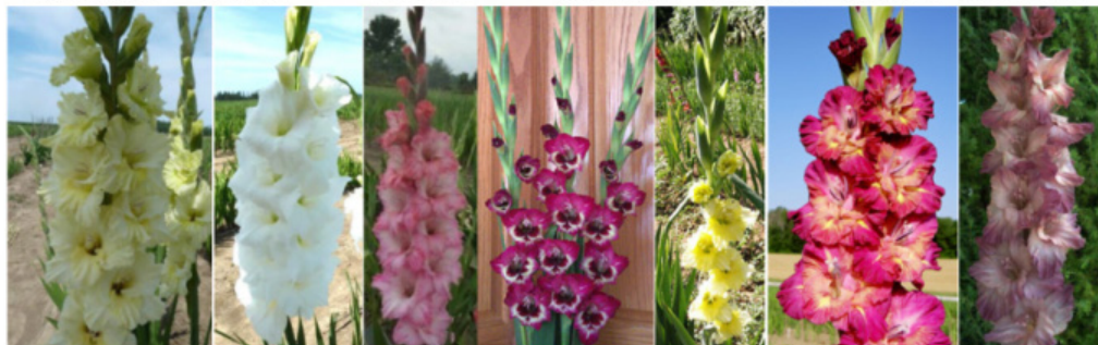
GLITZ & GLAM