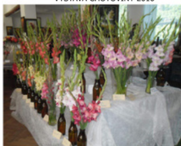
VÝSTAVA MORAVEC NA ŽDÁRSKU 2016