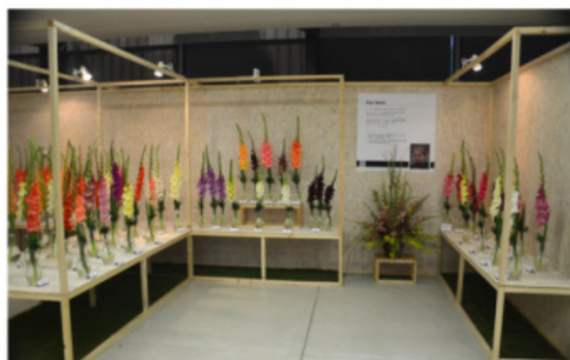
EXPOZICE PETR ŠMÍDA