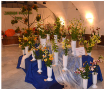
VÝSTAVA LILÍ ŽIROVNICE 2016