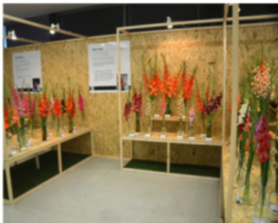
EXPOZICE PETER LELEK