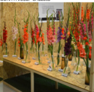
EXPOZICE JOZEF KOCIÁN