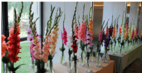
VÝSTAVA RYBNÍK 2016