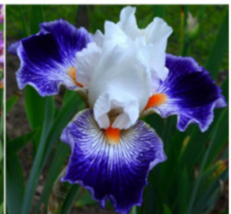
MODRÝ TYGR (BB)