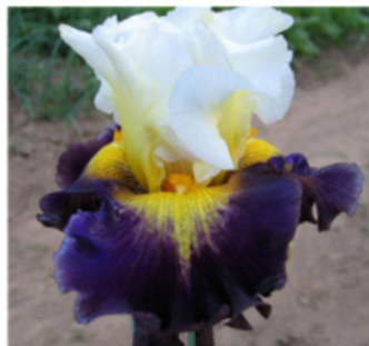
FLASH OF BRILLIANCE