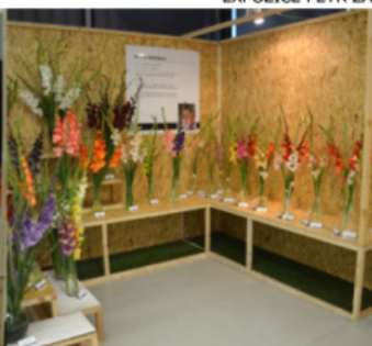
EXPOZICE HELENA KUBÍČKOVÁ