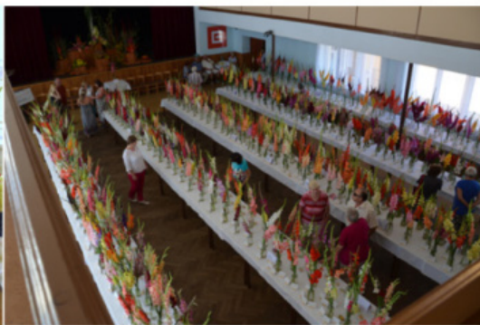
VÝSTAVA NEZNAŠOV 2016