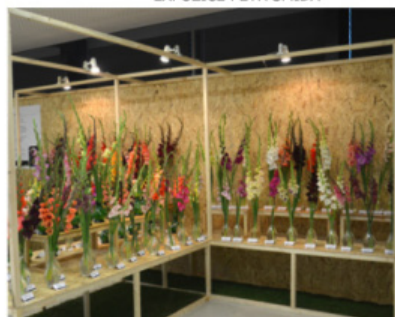
EXPOZICE JIŘÍ PETR