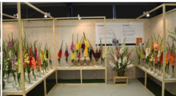
EXPOZICE PETR ZAGORA A JOSEF CHLEBIŠ