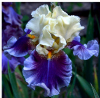
NOC V PACIFIKU