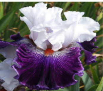
SIR NICHOLAS WINTON