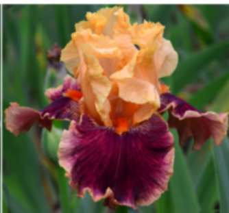
GARNET IN AMBER