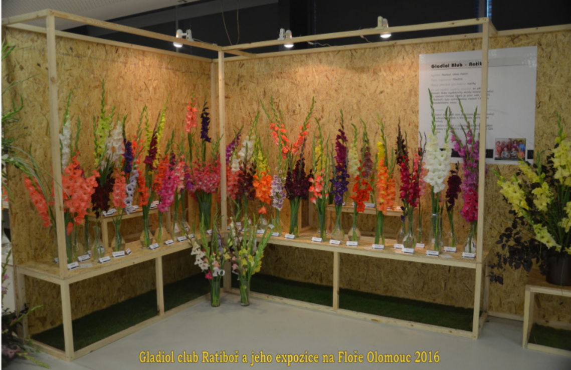
Gladiol klub Ratiboř a jeho expozice na Floře Olomouc 2016