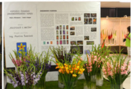
PANEL GLADIRISU FLORA OLOMOUC 2016