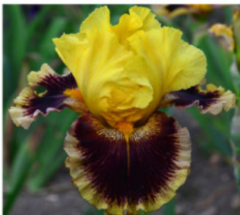
POTĚŠENÍ MISTRA PAVLA