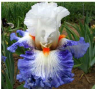
GUARDIAN 'S FIRE