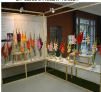
EXPOZICE VILIAM PAULÍNÝ