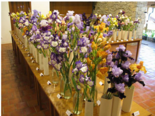
Výstava kosatců v Nepomuku