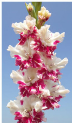
ALL IS ROSY