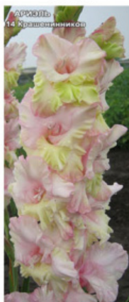
АРИЕЛ 14 Крашенеников