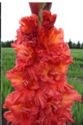
SPICE OF LIFE