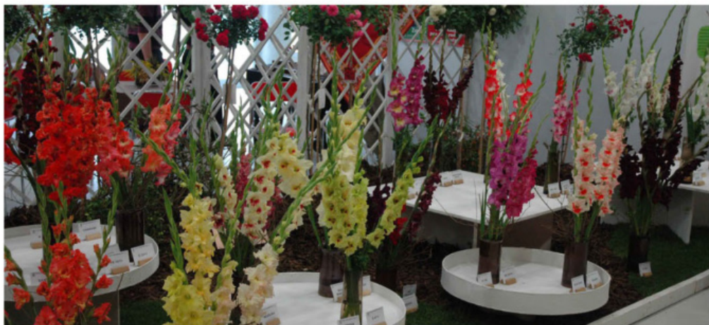
Výstava Flora Olomouc, expozice Petra Šmídy