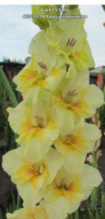
БАРГУЗИН 420-2014 Крашенеников