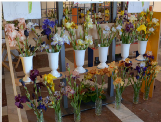
8. ročník výstavy kosatců v národním památníku Lidice