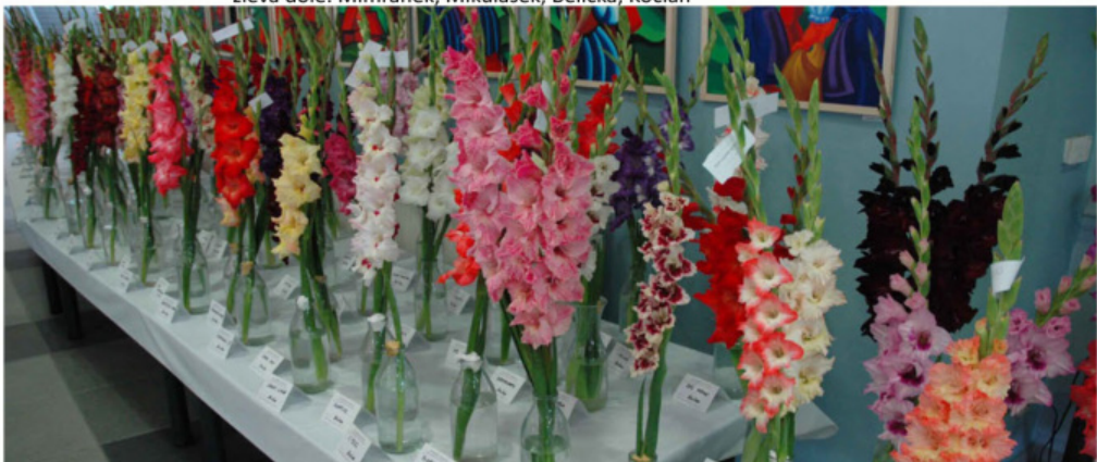
Z výstavy mečků v Žilině