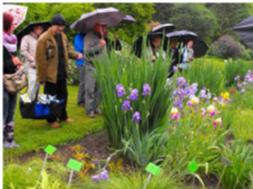
Arboretum v Bolestraszycích