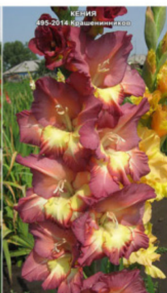
КЕНИЈА 495-2014 Крашенеников