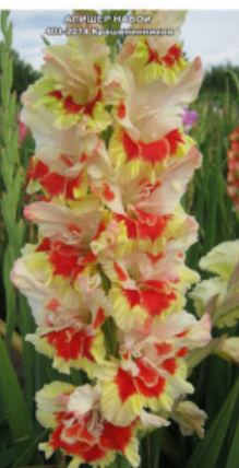
АЛИШЕР НАВОИ 303-2014 Крашенеников