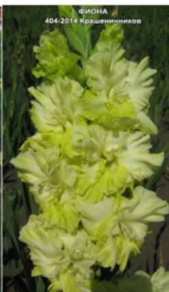
ФИОНА 404-2014 Крашенеников