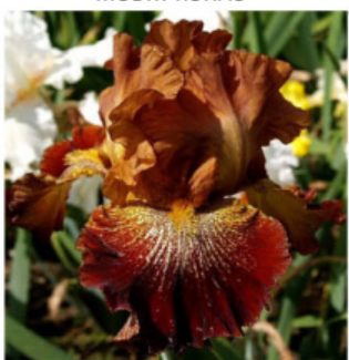
SUN BROWN BUBBLING