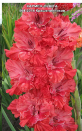
КАРМЕН СУИТА 564-2014 Крашенеников