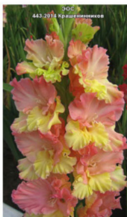
EOS 443-2014 Крашенеников