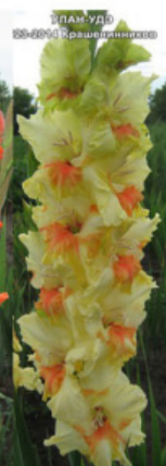
УЛАН-УДЕ 350-600 Крашенеников