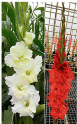
MINNESOTA MORNING PRAIRIE EMBERS