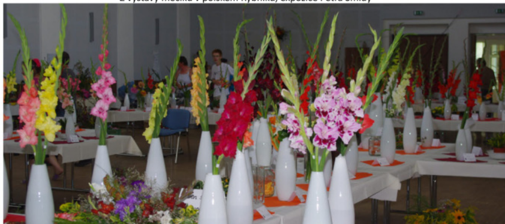
Výstava mečičků v Rapotíně