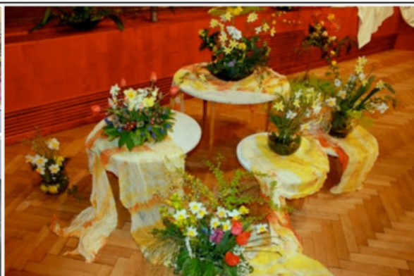
Z výstavy narcisů v Bolaticích