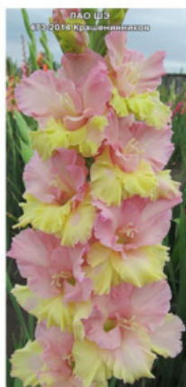
ЛАО ШЕ 33-2014 Крашенеников