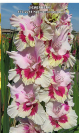
ФЕЈЕРВЕРК 473-2014 Крашенеников