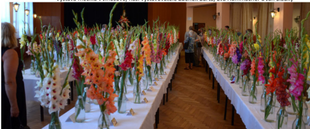
Výstava mečičků v Krakovanech na Slovensku