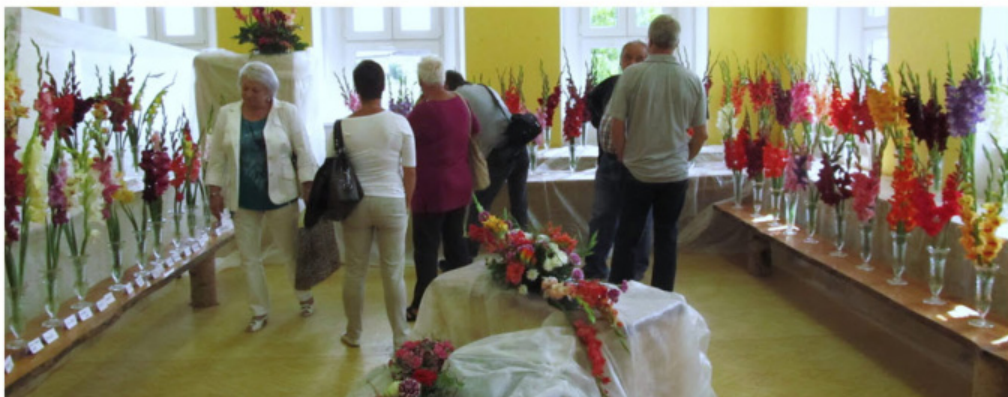
Z výstavy mečků v Nemyčevsi