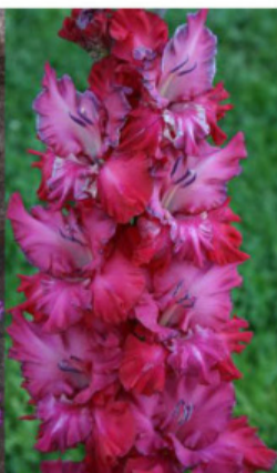
ČERNIKA V LUKOŠKE