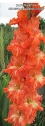
КАРЕЛ ЧАПЕК 407-600 Крашенеников