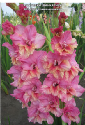
АНАТОЛИЈ ШИНКАРЧУК 465-2014 Крашенеников