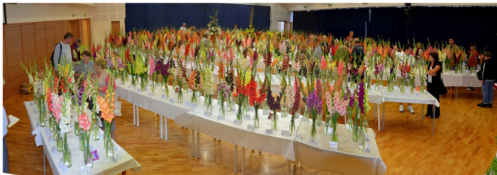
Mezinárodní výstava mečků v Bytči 2012