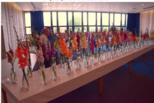
Výstava mečků v Bojnících 2012