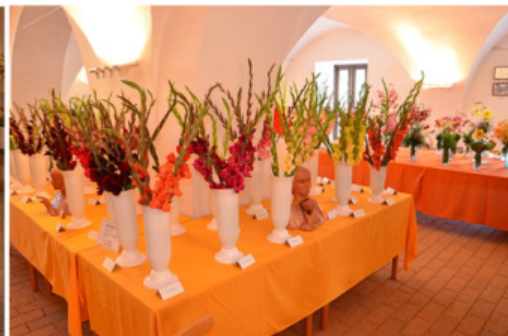
Výstava květů ve Volyni 2012