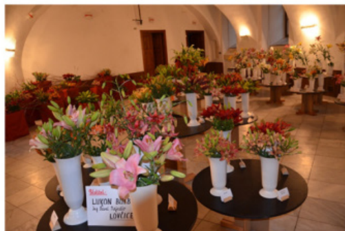
Výstava lilii Žirovnice 2012