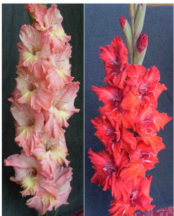
FAIRIES TOUCH DALAI LAMA'S LIGHT