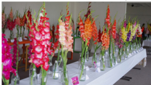
Výstava mečků v Martine 2012