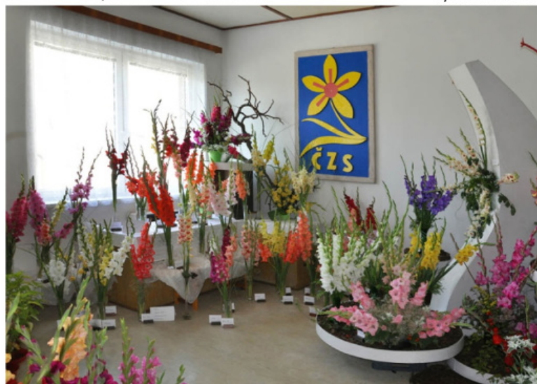
Výstava mečíků v Holešově 2012