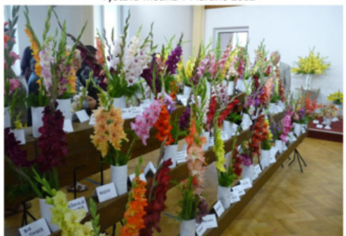
Výstava mečků ve Vysokém Mýtě 2012