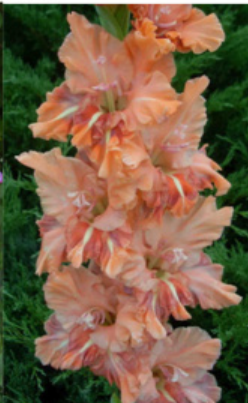
TIGER 'S DREAM