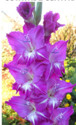
THE KING 'S KISSES