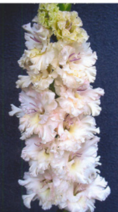
JUBILEJ ŽURNALA "CVETOVODSTVO"