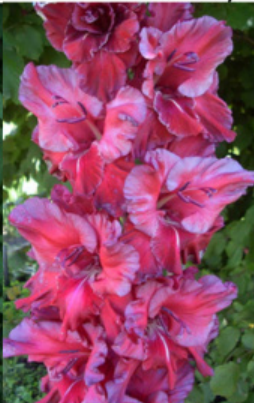
NAKTIS SU MULATE