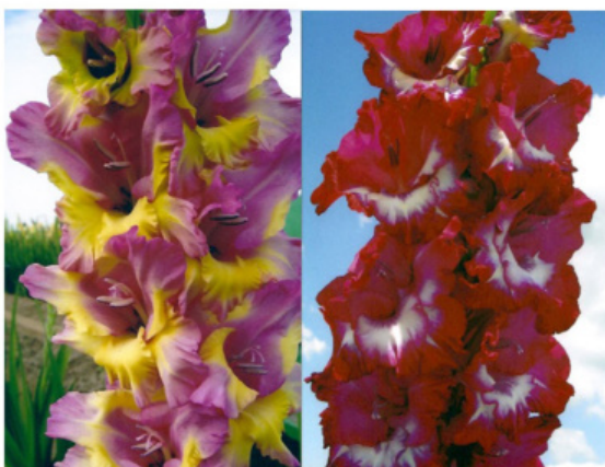
PRIDE AND JOY