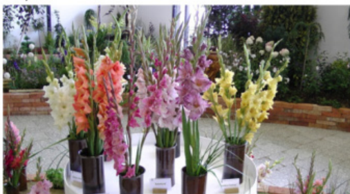
Z výstavy Flora Olomouc 2012