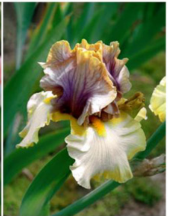
Mysterious Ways (Keppel 04)