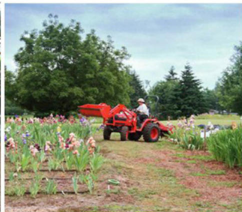
V zahradě u Aitkenů