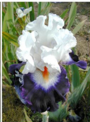
Sem. 99 - 43 S (Keppel)

Sem. L 83 C (Black) – dóm krémově bílý s nepatrným žlutým lemem, spodní část fallů má na žlutém podkladu kaštanově hnědou žilkovanou kresbu s krémovým lemem, okolo žlutooranžových kartáčků je velká světle šedivě bílá plocha s kaštanově hnědým žilkováním.