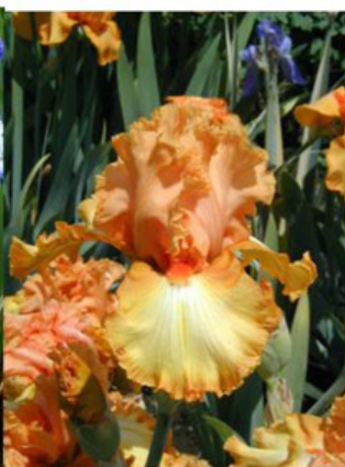
Sem. JJ 1674 -A (Schreiner)