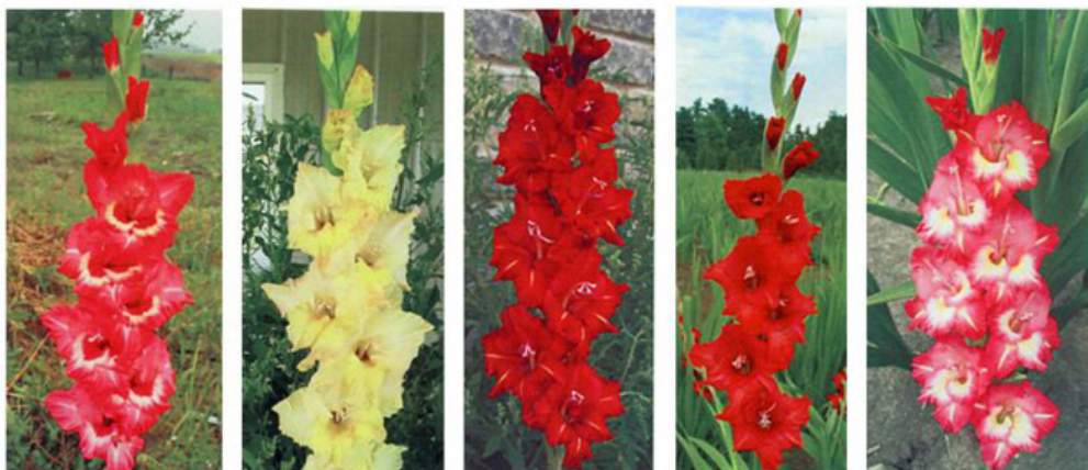
HOLIDAZZLE HONEY LOVE HURON MASK CHERRY BERRY CHERRY TART