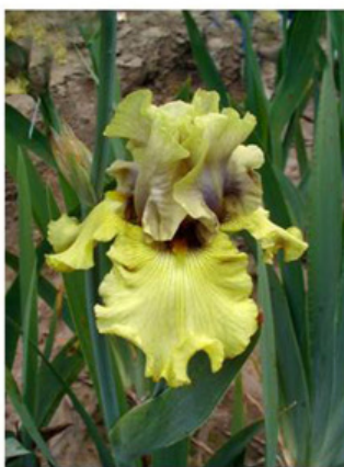
Sem. TW 17 A