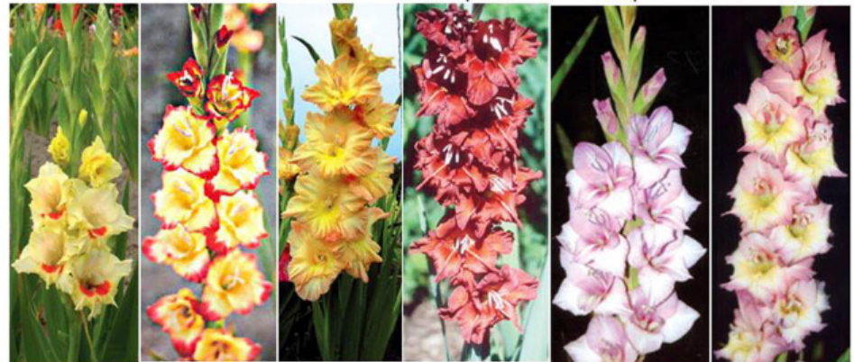
AZTALAN BURNING STARS GLO GIRL CHOCOLAT LAGUNA PLUM BUTTER