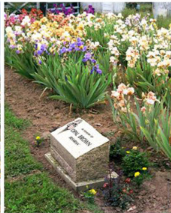
Pomníček šlechtitelky O. Brown u Meeků