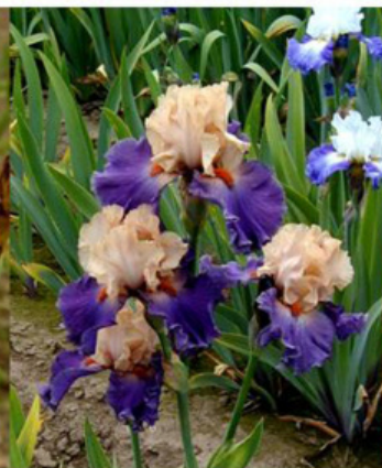
Sem. J - T 202 A (Johnson)