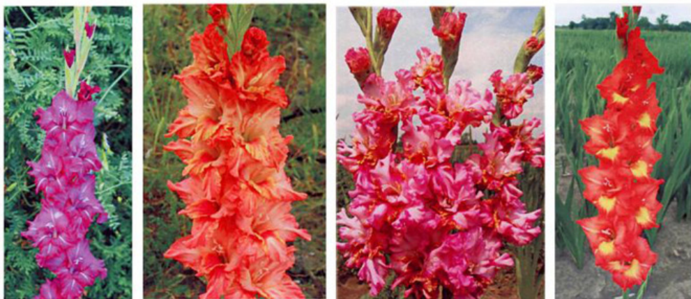
DAWN BOY ELLEN'S FURY FRIZZLE DIZZLE HAWAIIAN SUNSET