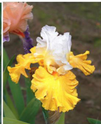
Tour de France (Keppel 04)