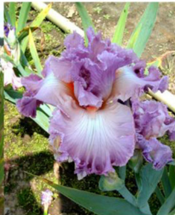
Sem. 99-104 A (Keppel)