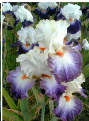
Sem. 99 - 43 C