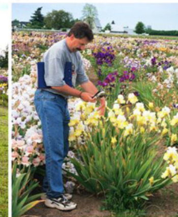
Dokumentace v zahradě Meekových