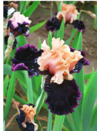
Prague (T.John. '05)