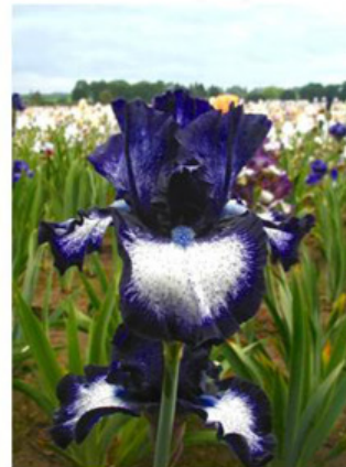
Oreo (Keppel 04)