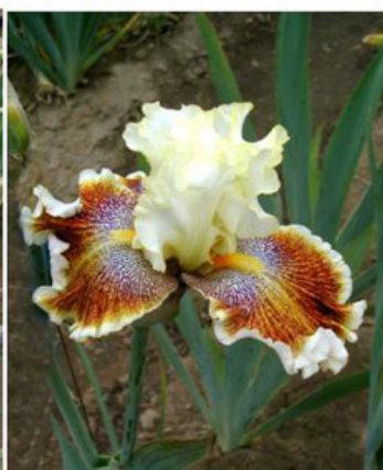
Sem. B - L 83 C (Black)