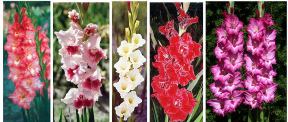
MARS ROSE PUNCH SNOFLAKES SYLVIA'S CHOICE STAR PERFORMER