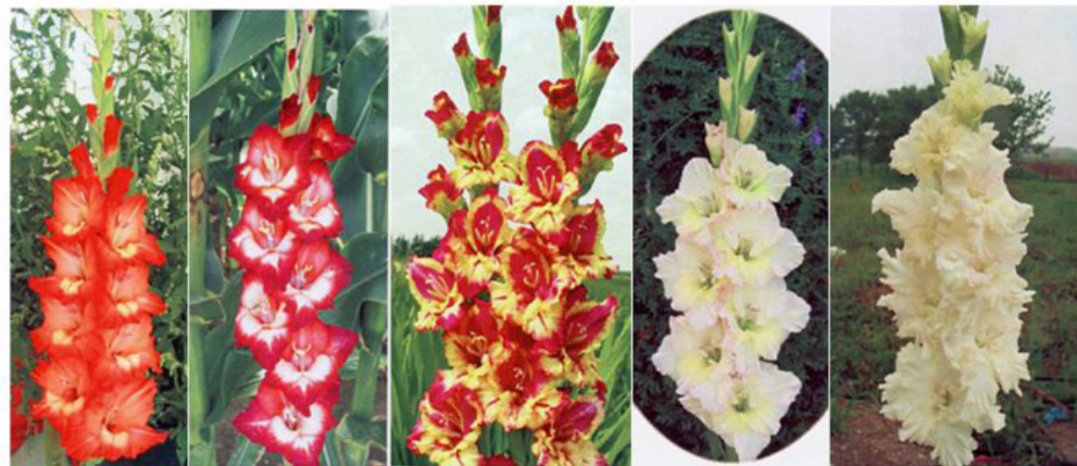
PUCKER UP ROBIN'S SPIRIT SPYRO STIENA WAX RUFFLES