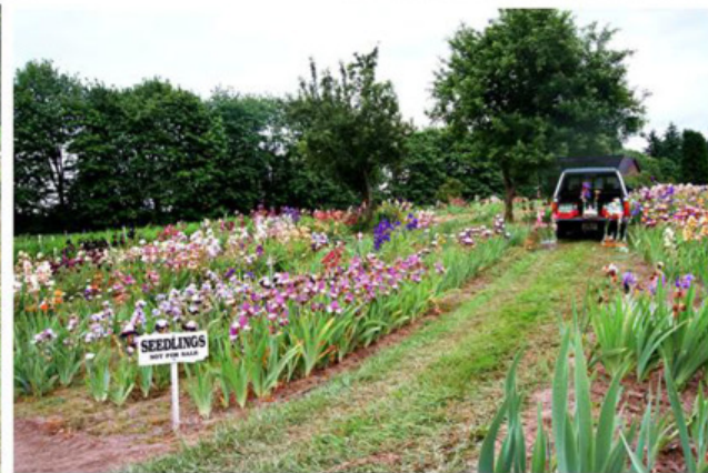
V areálu Aitken 's Salmon Creek Garden