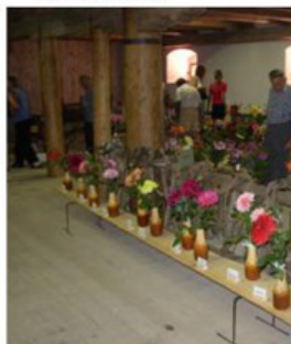
Žirovnice 2007: Jiříny ve špejcharu