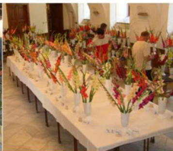
Expozice Jaroslava Konička