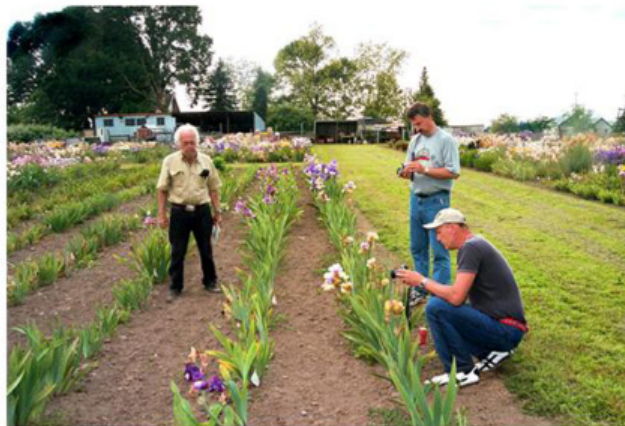
S panem Meekem