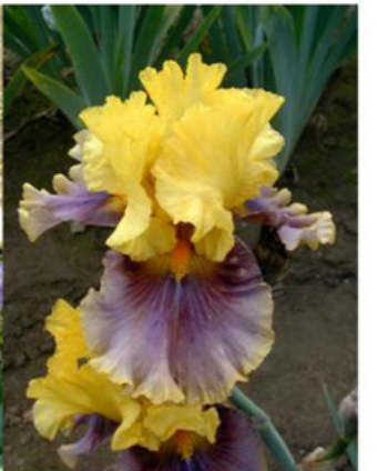
In Living Color