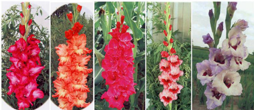
BUHLER'S HUMOR CANADIAN SUNSET CARIBBEAN BEAUTY CIRCUS CANDY DOUBLE VIOLET