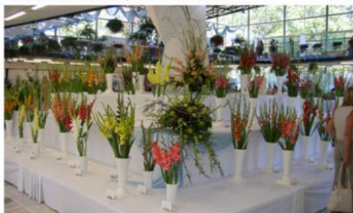
Flora Olomouc 2007: Expozice Petra Mimiránka