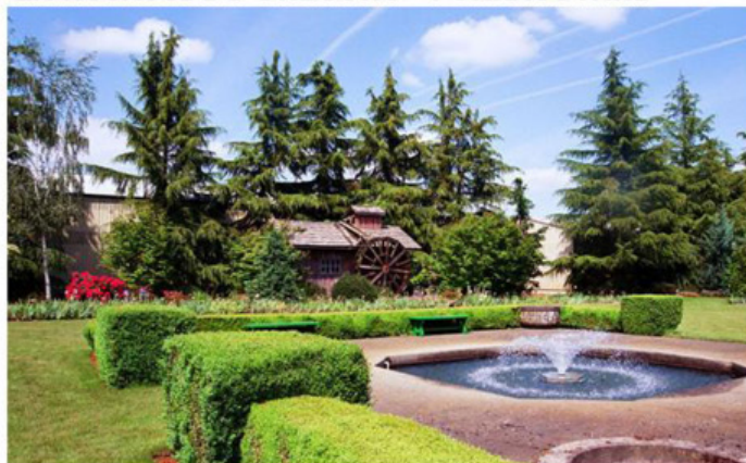
V areálu firmy Cooley's Gardens