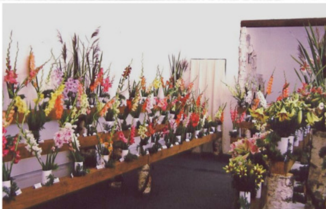
První výstava mečků a lilií v Letohradě 2006