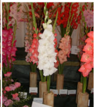
OF SINGULAR BEAUTY