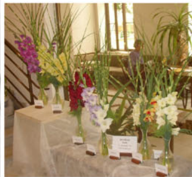
Expozice Emila Dvořáka