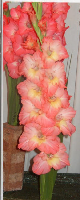
Sem. 47/01 Saran