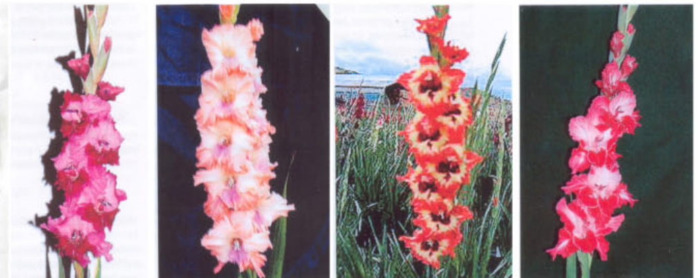
L-75 LINGERIE PICANTE ROYALTY ROSE