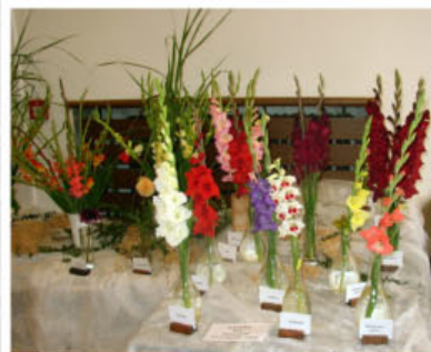
Expozice Petra Zagoru