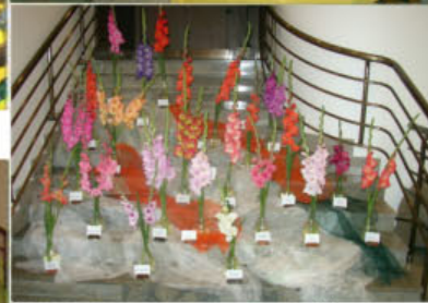
GLADIOLA MARTIN – 2.a 3. část