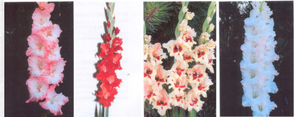
ALWAYS BURST DASHING F-63