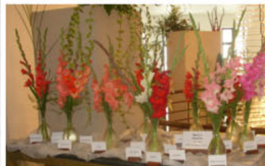
Expozice Stanislava Škuci