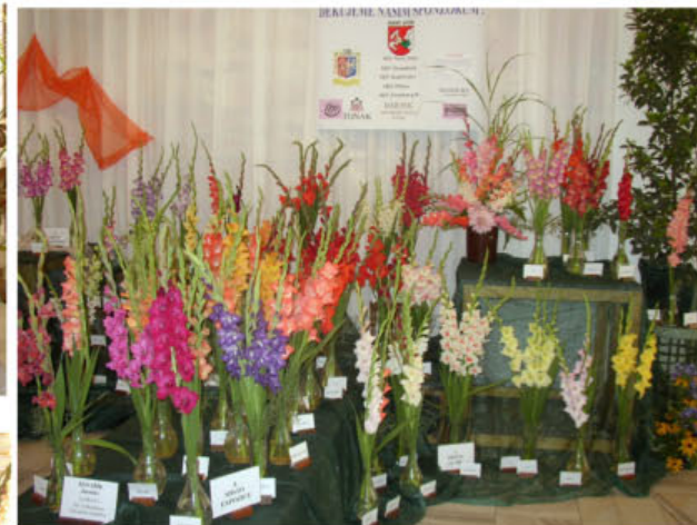
Expozice Jaroslava Kovaříka