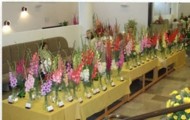
GLADIOLA MARTIN –hlavní část expozice