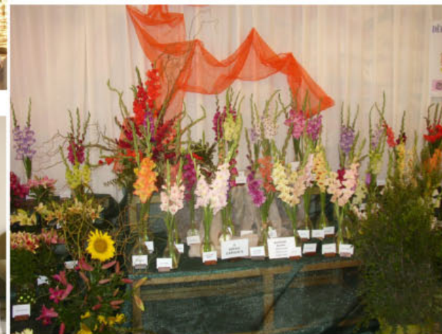
Expozice Jaroslava Konička