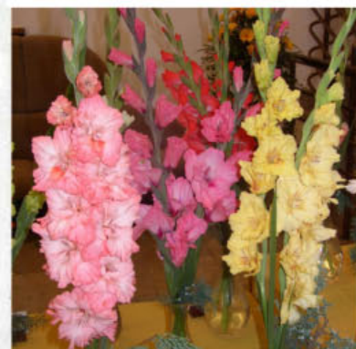
DORIN POLÁRNA ŽIARA GOLDEN FANTASY