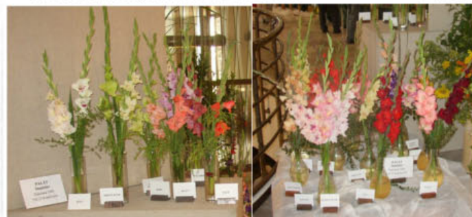
Expozice Stanislava Paláta