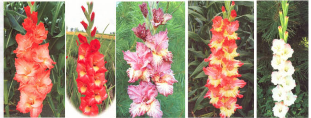
SCHRIMPBOAT SNAZZY TIGER KITTEN TIMELESS WEE WONDER