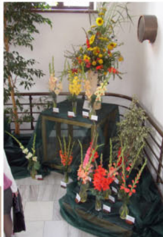
Expozice Jaroslava Hrabovského