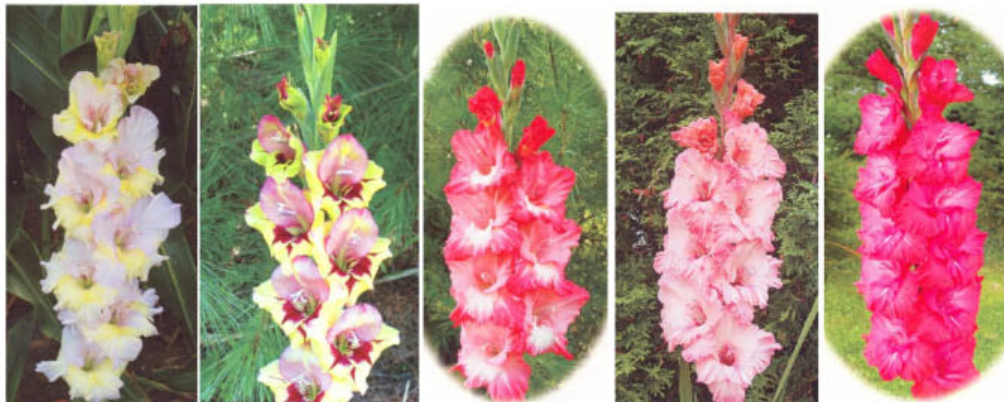
INSPECTOR'S CHOICE LITTLE COMET MOSSLE BAY PETRONELLA RINGMASTER