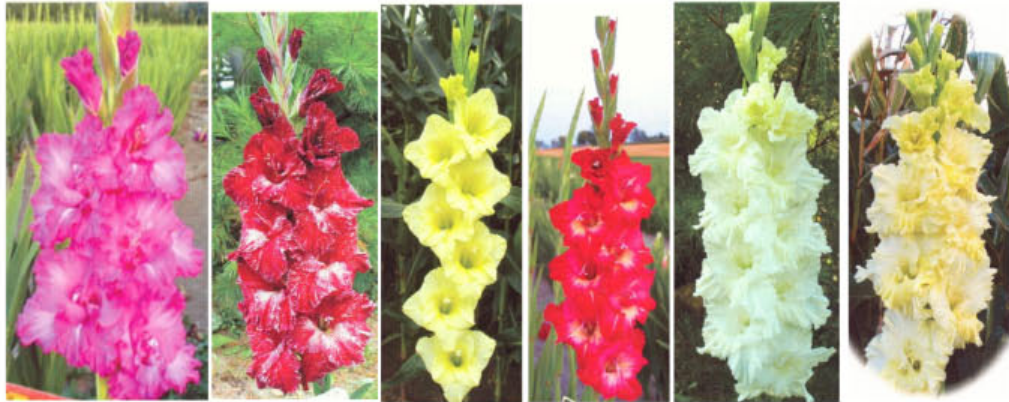
ARABIAN NIGHTS BLACKBEARD BUTTER BON BON CANDY STICK COTTON QUEEN CROWNING GLORY