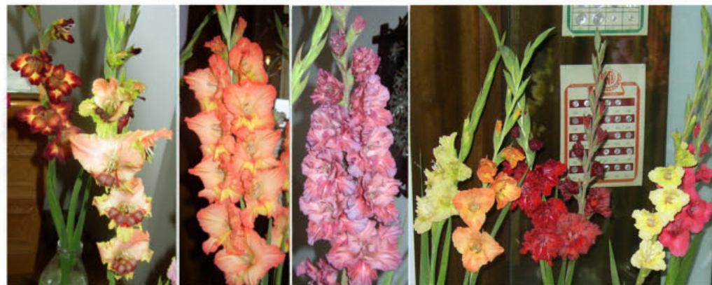
mečičků v ŽIROVNICI 2006

Část ukázky z novošlechtění Jaroslava Konička které představil na výstavě