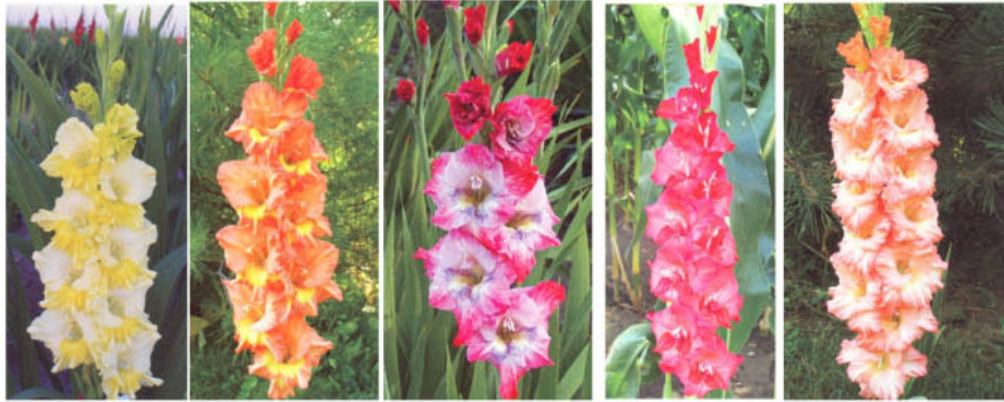
DORADE DREAMCATCHER EARLY EXPLOSION ED'S CONQUEST CHRISTINA