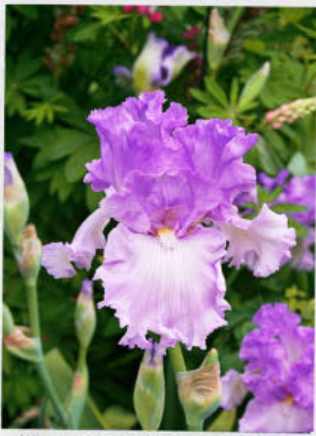
Morning Frost (Schreiner 04)