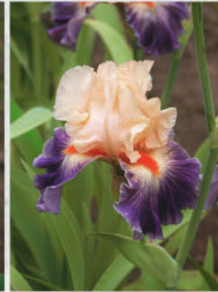
Undercurrent (Keppel 04)