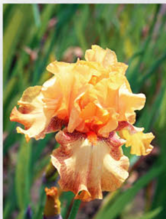
Sem. 91 A