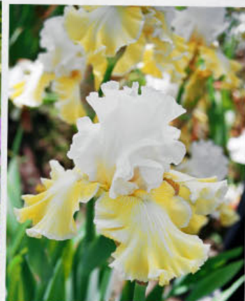
Sem. 00 254 B (Keppel)