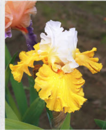
Tour de France (Keppel 04)