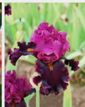
Sem. JT 208 B