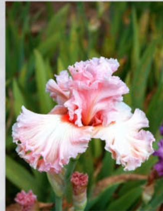
Sem. 00238 A (Keppel)