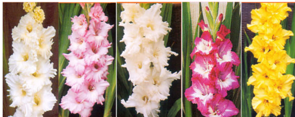
JANINA DION ALADIN IKKA GOLDEN FANTASY