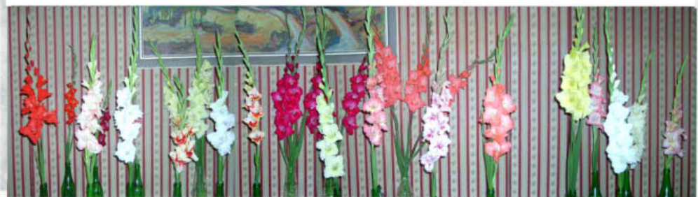
Výstava mečíků Prešov 2005