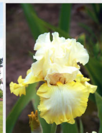
Sem .BL 43 B