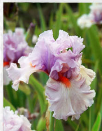
Sem . BL 65 A