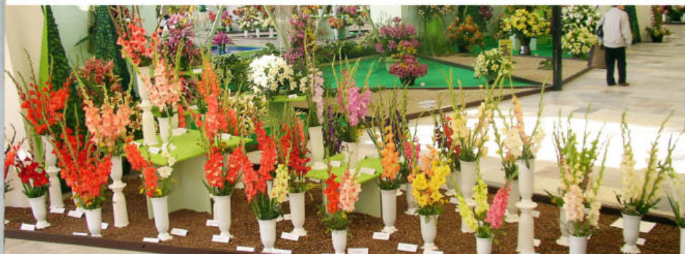
Expozice Jaroslava Hrabovského