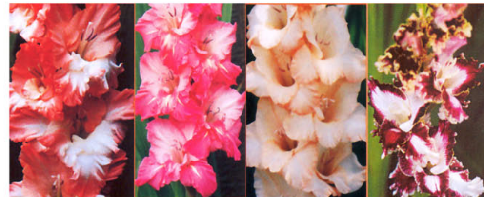
STARRY CHARM TORI TYANNA HARLEQUIN