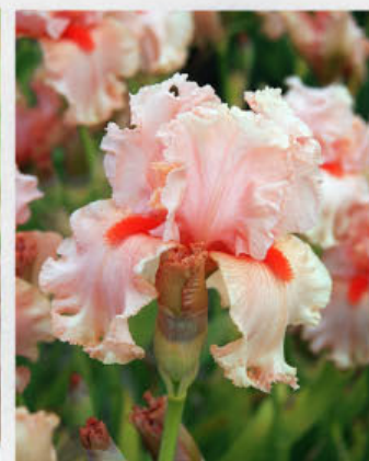
Sem. BK 37 R