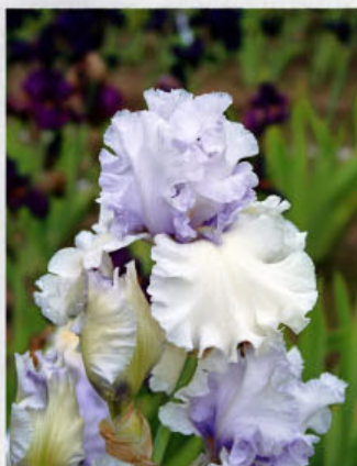
Chinook Winds (T. Johnson 03)