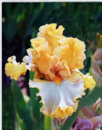
Sem. 99 189 H (Keppel)