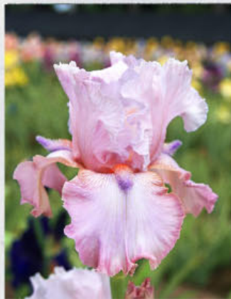
Power Point (T. Johnson 05)