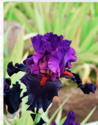
Saturn ( T. Johnson 05)