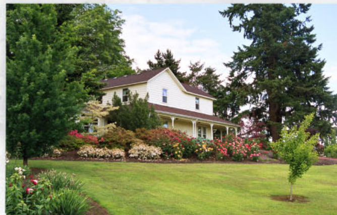
Sídlo Mid-America Garden