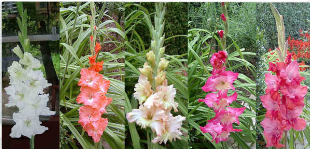
BIELE RÁNO KORALOVÝ OSTROV LETNÁ ROMANCA NATÁLKA ROSALINDA