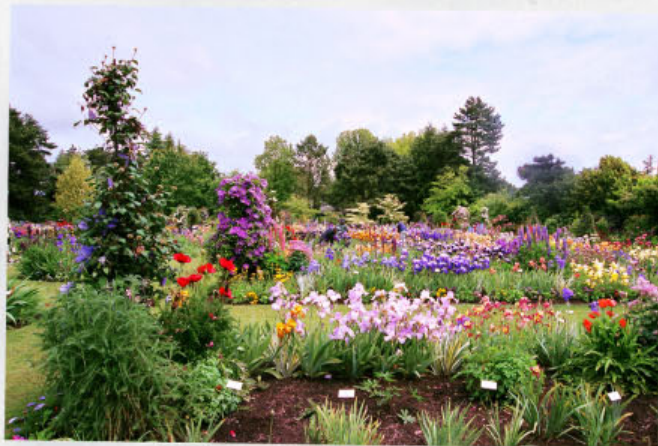
Expozice kosatců ve firmě Schreiner