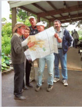
Nad mapou Salem a okolí