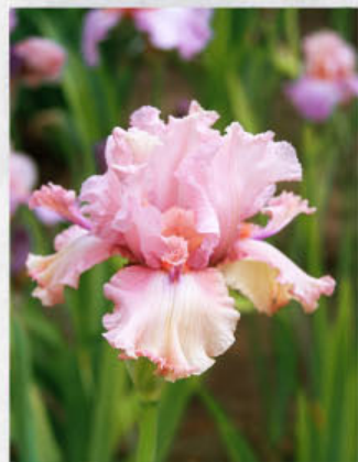
As You Were (Stahly 01)