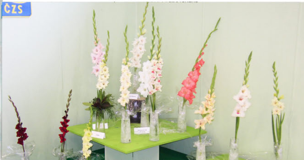
Vítězné mečky Flora Olomouc 2005