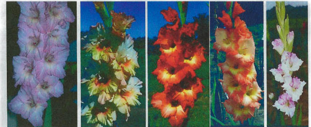
MOTHERS DAY NECTARINE SAXONY ORANGE JULIUS ORCHID LACE