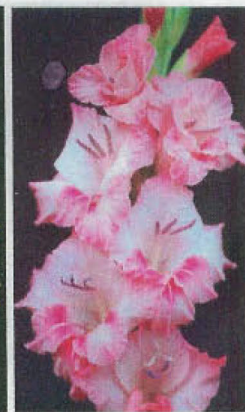
ZEE ZEE LYNN