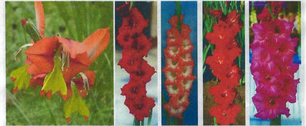
GLADIOLUS ALATUS JENNIS JOY LADY LUCILE RED HEART LAVENDER MASTERPIECE