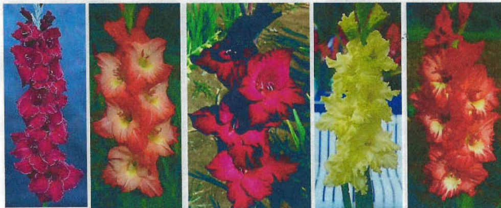
ROYAL BLUSH PARADE MAJESTIC PURPLE MAY BLOSSOM MOUNTAIN MELODY