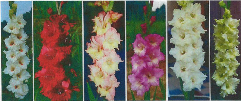
ABUNDANCE ALLEGRO APOLLO COOL WATER CREAM OF THE CROP CREME DE MINT