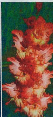
NU GROMOV POGODI