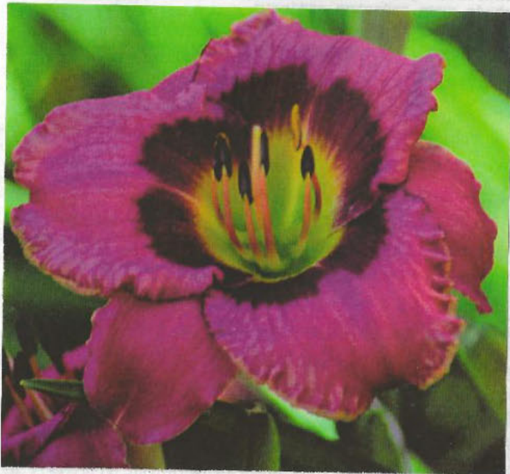
ALWAYS AFTERNOON ( MORS )

RASPBERRY CANDY (Stamile) - bílá se zlatým leskem, fialové červený trojúhelníkový prstenec, tmavě zelené hrdlo.