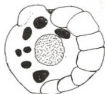
◀ Pseudomonas marginata (bakteriální hniloba)

Proti Botrytis v květu aplikujeme: Benlate, Funaben 50, Fundazol 50 WP, Ronilan 50 WP, Derosal 50 WP, Bavistin v koncentraci 0,06 % postřikem.