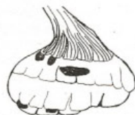
▶ Stromatinia gladioli (tvrdá hniloba)