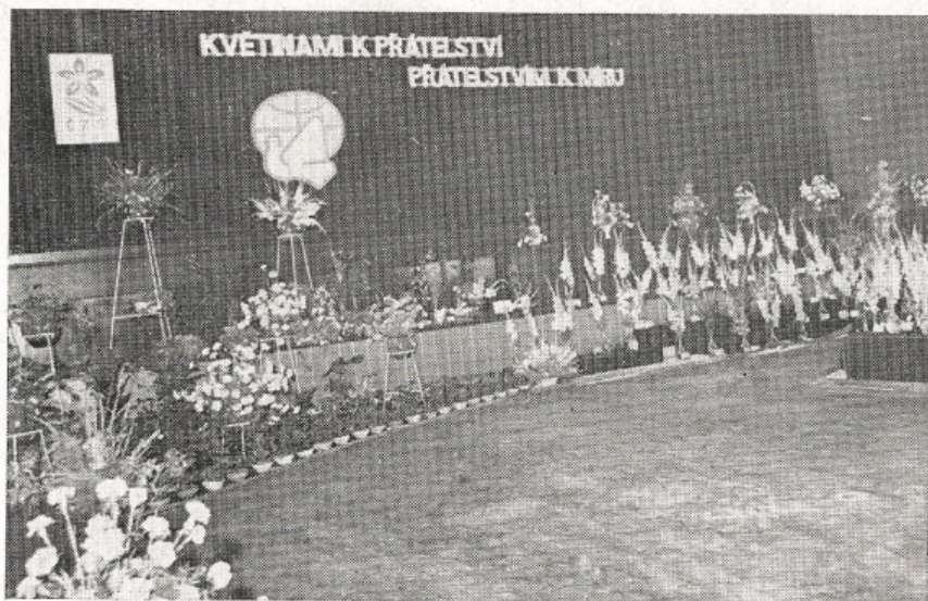
Čelní stěna výstavního sálu s ústředním heslem.