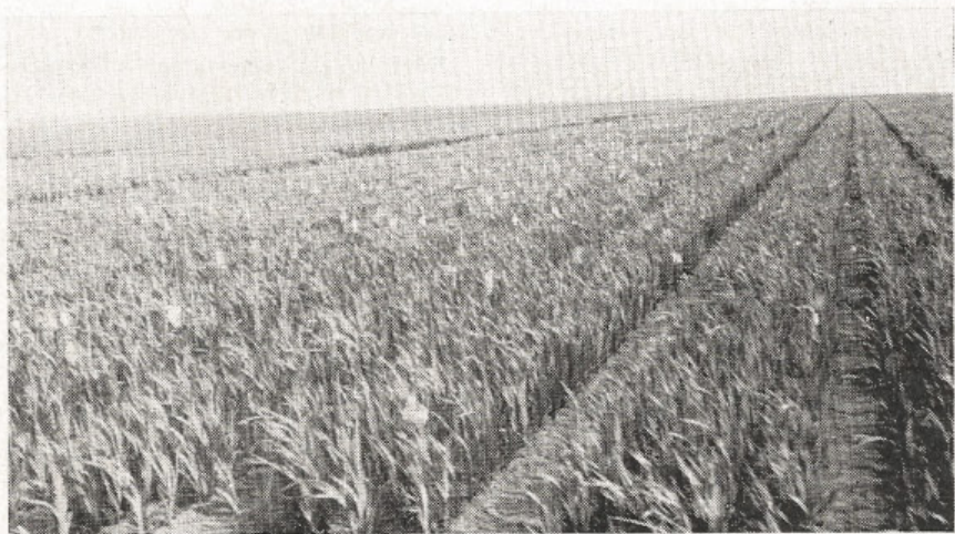
Tak vypadá velkovýroba, mečiky kam oko dohlédne