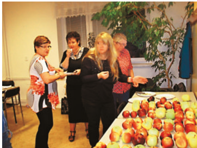
Degustace jablek na školení

Již po dvacáté se sešli instruktoři a odborníci ČZS v Ostravě na internátě Střední zahradnické školy, na každoročním pravidelném dříve třídním, nyní již jen dvoudenním školení.