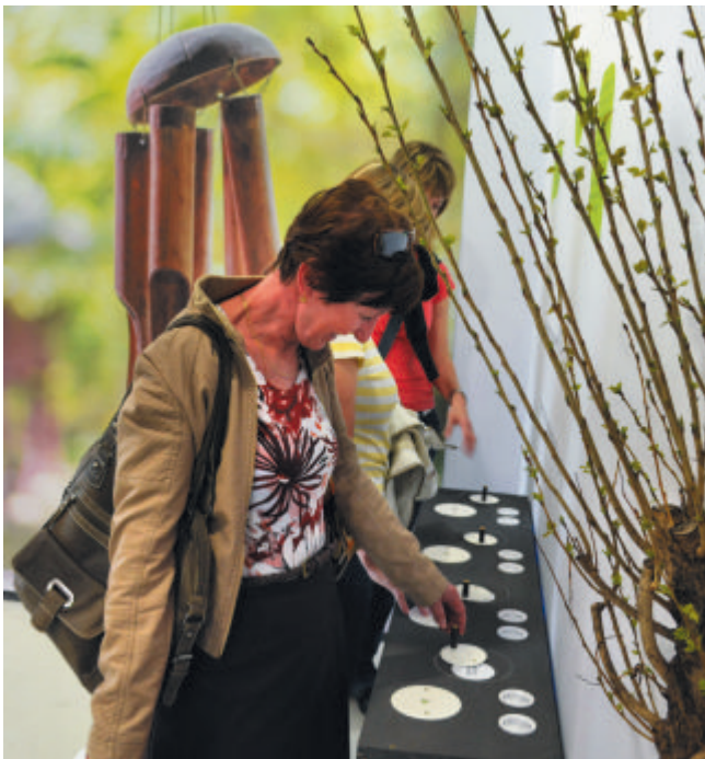
Interaktivní expozice zvuků zaujmula nejvíce návštěvníků. Na panelu si všichni mohli zkusit, zda poznají hlasy opeřenců našich zahrad.

ných státech jsou české děti ještě schopny správně odpovědět, že brambora roste v zemi. Je však zřejmé, že možnost koupit si sezónní ovoce a zeleninu nepfetržitě během celého roku děti mate. I ty starší děti kolem 15 let tak mají skutečně problém stanovit, kdy jaké ovoce dozrává. O poznání jistější si byly v této otázce děti, které chodí s rodiči či prarodiči na zahrádku," zhodnotila průběžné výsledky testování mluvčí ČZS Zdeňka Jankovičová.