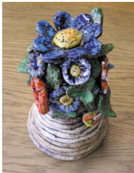
1. místo - polytechnická práce "D"