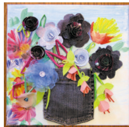
2. místo - polytechnická práce "D"