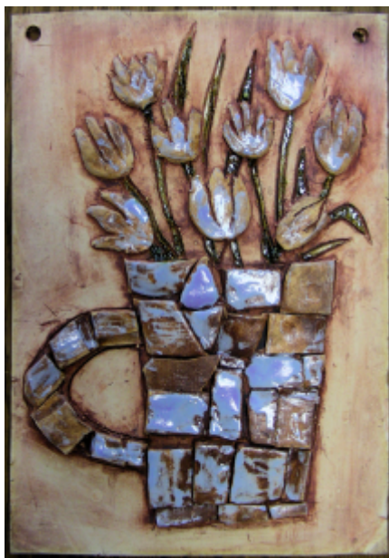
3. místo - polytechnická práce "B"