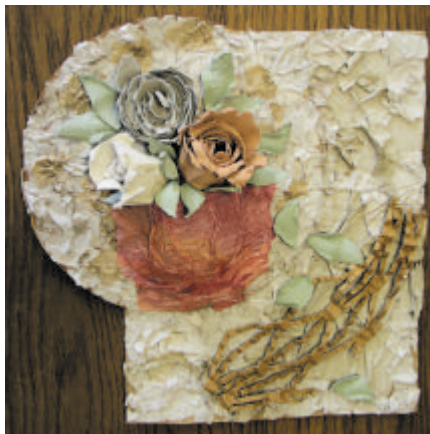
1. místo - polytechnická práce "C"