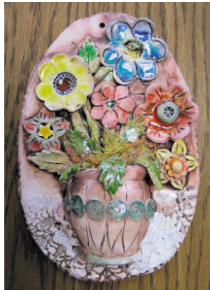
1. místo - polytechnická práce "B"