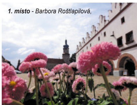
1. místo - Barbora Roštlapilová,