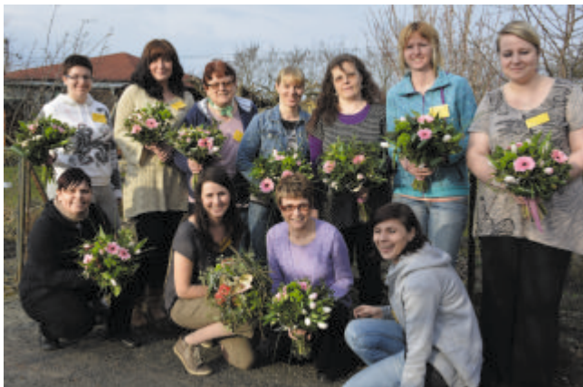
Účastnice pražského školení v ZO Na Skalce

Nové vedení Českého zahrádkářského svazu pokračuje v přeměně Svazu v moderní spolek, jenž cílí na podporu komunit i větší atraktivitu pro mladší ročníky. Prvním projektem, který má ukázat novou tvář českých zahrádkářů, se stal Floristický kurz ČZS uspořádaný v březnu 2015 v Praze a v Olomouci.