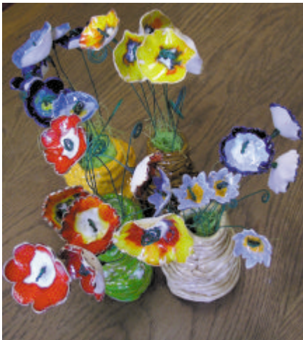
1. místo - polytechnická práce "A"