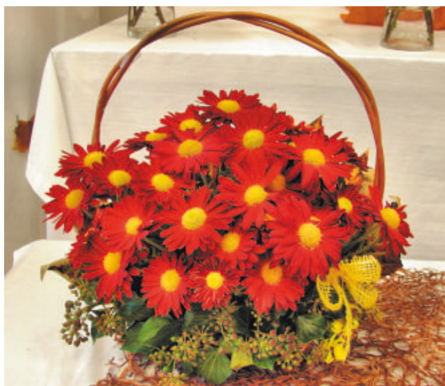
Chryzatéma: Šlapanická Eliška

Šlapanice byly a jsou známy svými výstavami květin a také lidmi, kteří město Šlapanice proslavili v oblasti pěstování a šlechtění květin.