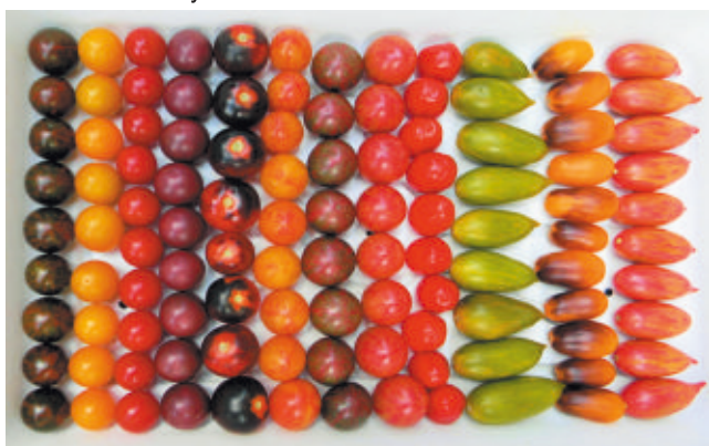
Kolekce nových odrůd rajčat