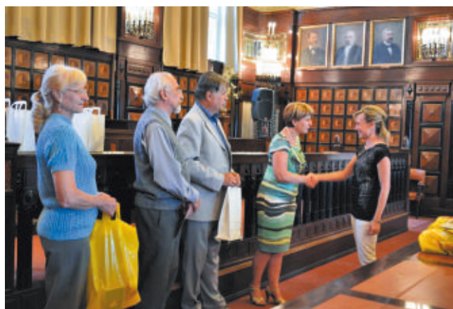
Nádherný interiér radnice podtrhl význam soutěže pro účastníky

Jedna z doprovázejících učitelek sdělila, že "pro všechny to byl moc krásný, nezapomenutelný zážitek".