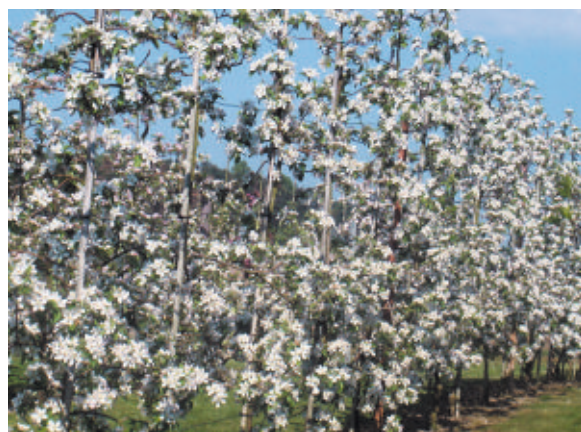
Týden po rozmrznutí stromy plně kvetou, foto: 24. 4. 2014