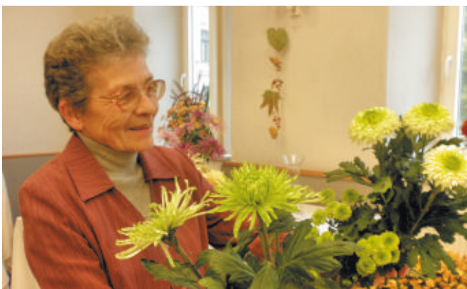
Zelené druhy chryzantém - Anastázie, santiny, Ray green

Šlapanice jsou samostatným městem v okrese Brno-venkov. Organizace zahrádkářů zde byla založena po celorepublikovém sjednocení 29. 9. 1957 jako pokračovatel předchozích zahrádkářských spolků, které mají ve Šlapanicích dlouholetou tradici. První okrašlovací spolek byl založen již 17. března 1912.