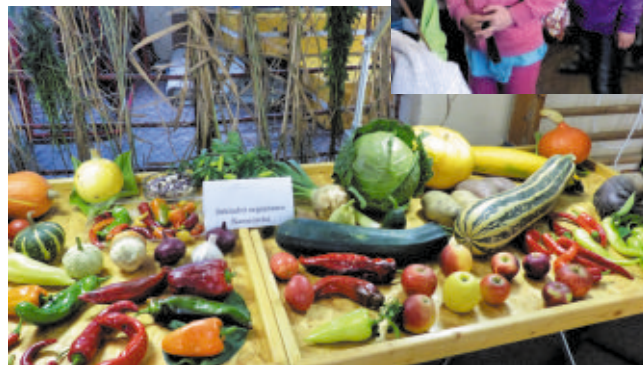
Expozice jednotlivých základních organizací: ZO Kamenická – snímek nahoře, ZO Varnsdorf – snímek dole.

Výstava trvá vždy 3 dny a je hojně navštěvovaná dětmi z mateřských školek, ale i žáky ze základních škol a studenty ze středních škol sídlící v Děčíně. Výstava má během jejího trvání až 7.000 návštěvníků. Největší zájem je o pěstitelské úspěchy zahrádkářů v podobě velkých výpěstků různé zeleniny či ovoce a o pěstitelské úspěchy v pěstování méně známých druhů, např. malé kiwi, či pepino. Velkému zájmu a oblibě se těší i poradní