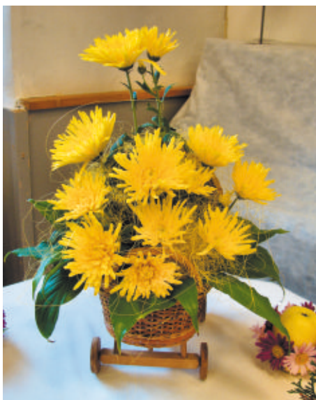
Jehlicovitá chryzatéma - Kodiak

Současná ZO ČZS ve Šlapanicích navazuje na své předchůdce a pořádá každoročně v Orlovně dvě výstavy.