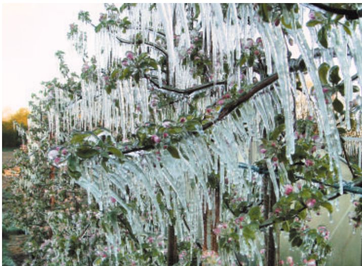
Stromy pokryté ledem po nočním zadešťování, foto: ráno 17. 4. 2014

V noci ze 16. na 17. 4. kdy klesla venkovní teplota až na -4,5\text{ }^{\circ}\text{C} bylo zadešťování v provozu od 22.30 hod. do 8.30 hod. Na plochu cca 750\text{ m}^2 se spotřebovalo asi 12\text{ m}^3 vody. V noci z 18. na 19. 4., při poklesu teploty na -2,0\text{ }^{\circ}\text{C} , bylo zařízení v provozu od 1.30 hod. do 7.30 hod. a bylo spotřebováno asi 6\text{ m}^3 vody. Lze říci, že tímto zásahem bylo zachráněno asi 90 % květů a o týden později (24. 4.) byly stromy v plném květu. Včely, čmeláci a divoké včely mohly od rána do večera pilně pracovat při jejich opylování.