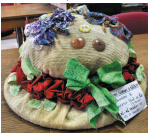
Polytechnická práce "B" 10. místo ZŠ Rasošky Kolektiv dětí ze ŠD 7-10 let