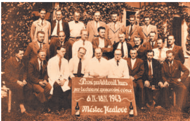
Muzeum uchovává i zajímavé fotografie z válečného období.

výčtu aktivit Zahradnického muzea je zřejmé, že muzeum plní účel, pro který bylo zřízeno a dobře prezentuje Český zahrádkářský svaz na veřejnosti, což je zřejmé i s pochvalných zápisů v návštěvní knize muzea.