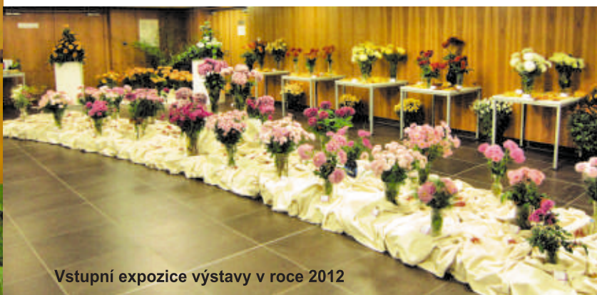
Vstupní expozice výstavy v roce 2012

Tradice místních výstav je dlouhá, v minulých letech byla návštěvnost téměř tři tisíce, ale v posledních letech klesá, tak jak se celkově snižuje zájem o výstavy.