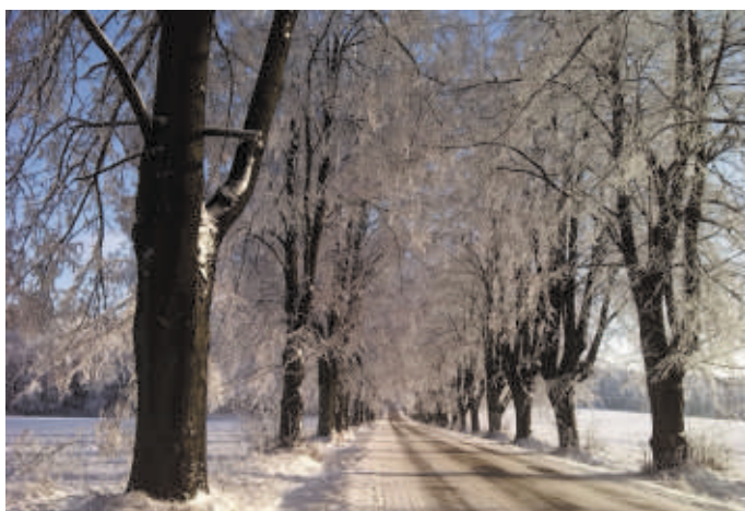
2. místo, kat. B - Nikola Hrabcová