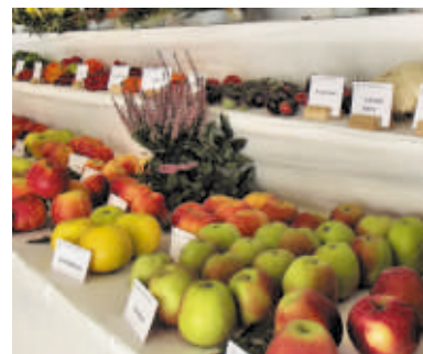
Pohled do expozice ČZS v roce 2013

Tato výstava bude tradičně umístěna v pavilonu G o rozloze 560 m 2 . Je to výstava zahrádkářů a pěstitelů ovoce a zeleniny. Ale také budou k vidění podzimní květiny, jako jsou chryzantémy, eustomy... Představen zde bude i rodokmen révy s názornými ukázkami hroznů. Nebude chybět vinařské posezení a odborná poradna.