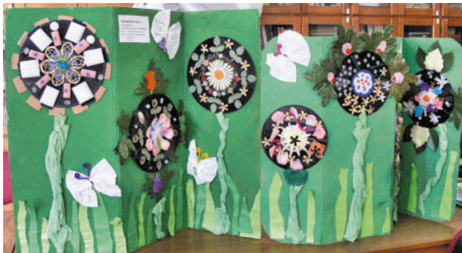
Polytechnická práce "A" 1. místo MŠ Údlice - Kolektivní práce