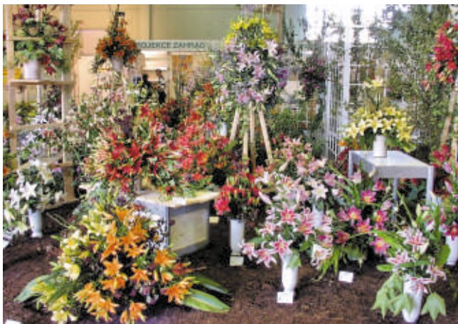
Výstava Květy v Lysé n. Labem, tradičně největší celosvazová výstava

předplatitelů nedosahují předplatitelé z řad ČZS ani 20 % a to včetně sníženého předplatného pro ZO. Většinu čtenářů tedy tvoří zájemci o odborné informace zahradnické informace.